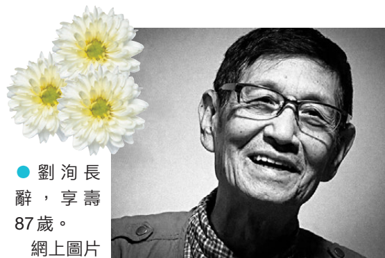
●劉洵長辭，享壽87歲。網上圖片