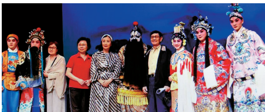
▲劉洵(右四)不遺餘力培育戲曲人才。資料圖片

香港文匯報訊(記者 阿祖)被譽為「千面如來」的京劇及粵劇大師劉洵，於29日與世長辭，享年87歲。其死訊由師弟羅家英透過社交平台證實：「今日(29日)下午6時。我的師兄劉洵先生離世了，屬兔，今年87歲了。」羅家英對於師兄劉洵的離世感到難過惋惜，也充滿懷念之情，遂發長文悼念這位德高望重的京劇大師，以及為粵劇發展貢獻良多的重要人物。