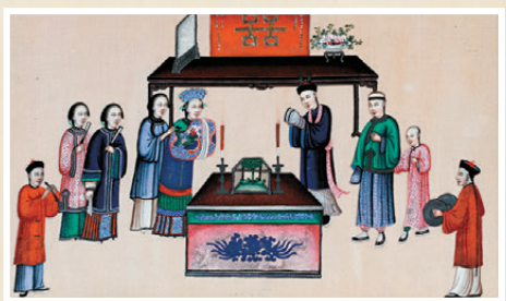
●廣州十三行博物館藏的清·通草水彩婚俗圖。

作為展覽的壓軸篇章，尾章「山海同春」則匯集民國彩粉太平有象瓷擺件，清代彩粉花卉開光「萬壽無疆」等寓意國泰民安的文物，讓吉祥的對話跨越古今，共同繪就「山海同春，萬家團圓」的動人圖景。