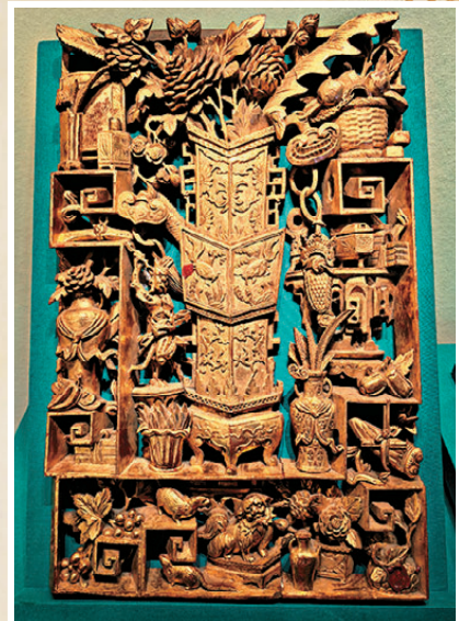
●廣州博物館藏的清·潮州金漆木雕花瓶雜寶紋飾板。