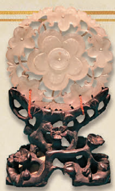
▲廣州博物館藏的明透雕梅花紋玉擺件。