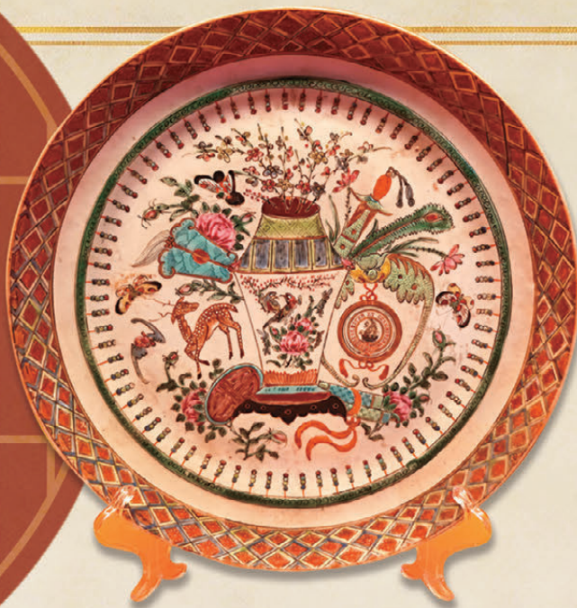
●廣州十三行博物館藏的清宣統年造廣彩博古徽章紋盤。