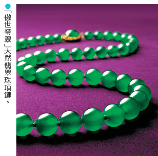
●「傲世瑩翠」天然翡翠珠項鍊。