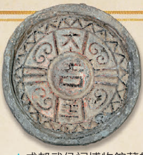
▲成都武侯祠博物館藏的漢·大吉羊雲紋瓦當。