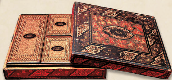
●荔灣博物館藏的清·黑漆描金遊戲盒。