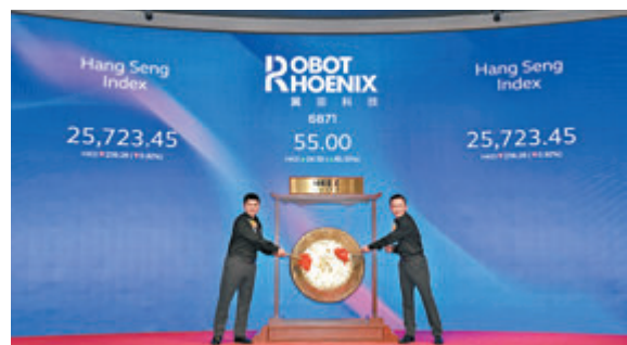
●內地科企翼菲科技(6871)早前於公開發售環創創高達近1.49萬倍的歷史超額認購紀錄，成港股「超購王」。

硬科技企業普遍存在「輕資產重研發」的特徵，在估值層面，如何在非實物類估值及無形資產的確認與財務合規上，提供審慎的判斷基礎，保障發行人經得住保薦人、監管與市場的多維考驗？對此，黃國鈞坦言，硬科技企業上市申報階段最容易形成重大判斷與審核壓力的範疇，集中於上市前收購及