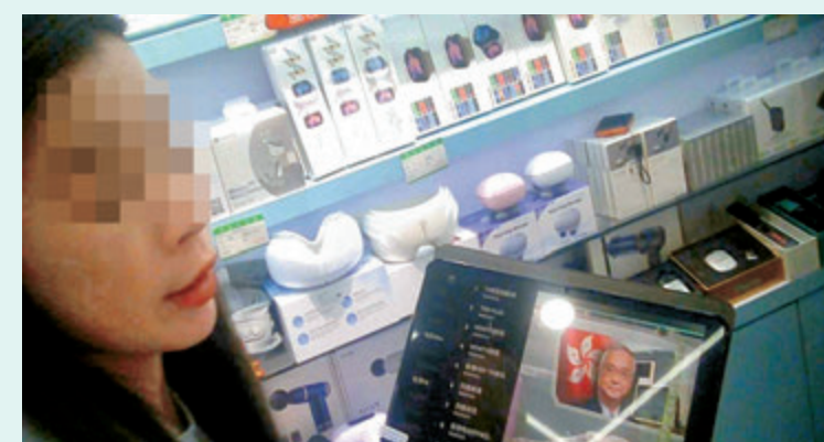
●華強北商戶女店員手持一部已聯網的平板電腦，向記者展示其可實時收看本港及海外多個付費電視頻道的畫面。

午後的鴨寮街人潮如鯽，出售電子產品的攤檔前不時傳出店員賣力的吆喝聲。香港文匯報記者沿路觀察，發現至少有10個檔口正公然售賣侵權機頂盒，部分店舖內更擺放着電視機作實時演示，畫面正播放着體育頻道。