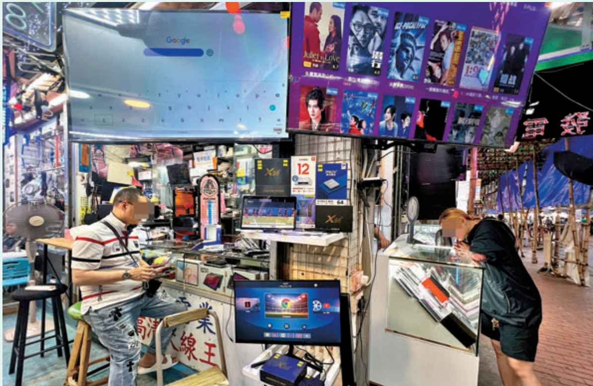
●隨著世界盃賽事臨近，深水埗鴨寮街人潮如鯽，市民在擺放了實時演示電視的檔口前駐足，觀看畫面上播放的影視平台選單。

四年一度的世界盃將於本月12日揭開戰幔，香港球迷熱熾期待精彩賽事，本屆世界盃的香港獨家全賽事轉播權由收費電視Now TV奪得，公眾或非指定客戶若想看足全數104場賽事，需購買980元的標準通行證。香港文匯報記者直擊發現，香港及深圳坊間湧現各種遊走於灰色地帶，甚至明目張膽盜看的軟件或硬件產品。其中深水埗鴨寮街最少十檔有售電視機頂盒，商販以「通通睇到」作招徠；至於深圳華強北更專攻香港人推出低至600元人民幣買平板電腦送盜看軟件優惠；自備手機或平板，亦可以180元至280元人民幣安裝有關軟件。不過，法律界人士及網絡保安專家提醒「免費的才最貴」，更可能成為黑客的獵物。 ●香港文匯報記者 廣濟