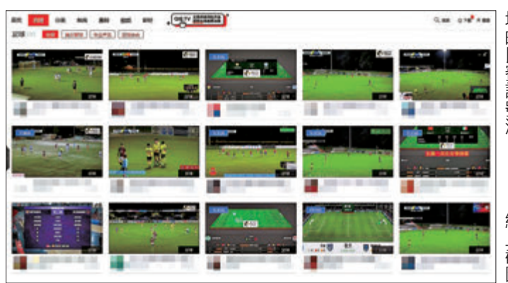
●網絡上充斥着大量「聚合型」體育直播網站，提供多個來自全球各地的比賽訊號源。

IP地址切換至其他國家或地區，繞過區域版權限制，免費收看當地已購入轉播權的官方頻道。