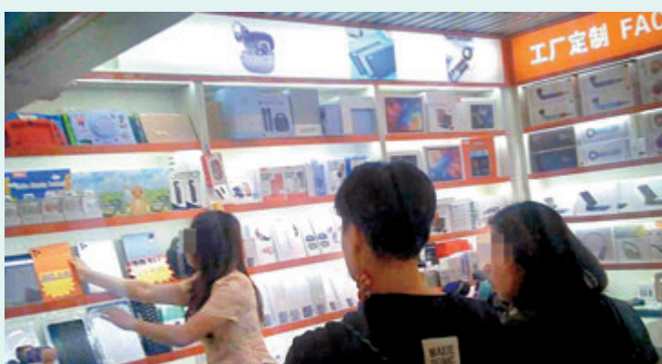
●世界盃即將揭幕，有港客在華強北商舖內圍攏，向店員端詳及查詢看球平板電腦的詳情。