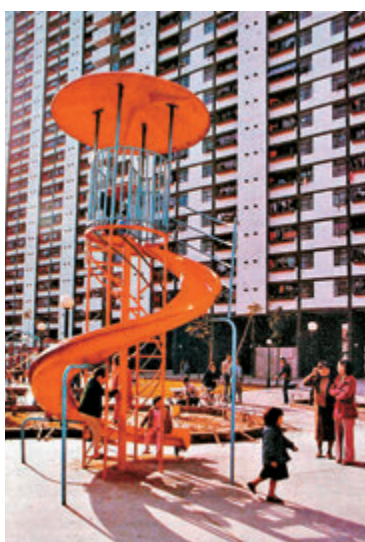
▲1983年乙明邨遊樂場。