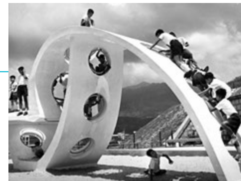
▲約1970年代石籬新區的遊樂場。