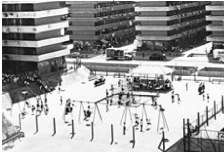
▲約1963年觀塘新區兒童遊樂場。 政府檔案處圖片

1964年 1964年前香港屋宇建設委員會轄下各邨多設有遊樂場。 政府檔案處圖片