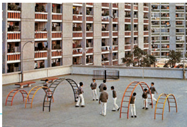
▲1975年愛民邨遊樂場。