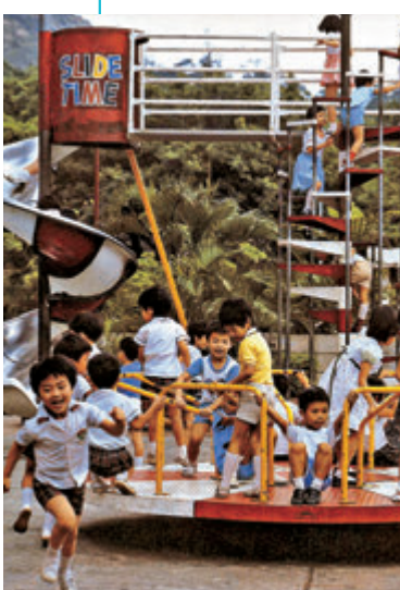
▲1983年屯門的兒童遊樂設施。