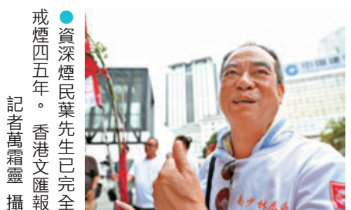
●資深煙民葉先生已完全戒煙四五年。

香港文匯報訊（記者 張茗）吸煙有害健康。昨日（5月31日）為世界無煙日，不少市民對禁煙政策表示支持。成功戒煙的葉先生擁有約50年的煙齡，他憑藉自身決心與信念，已完全戒煙四五年，其間未使用戒煙貼或糖。他分享自己十幾歲開始接觸香煙，年輕時更曾偷父親的香煙，就這樣一抽就是數十年，平均兩天抽一包煙，不算重度煙癮，但長年難戒掉。直至一次到診所覆診，