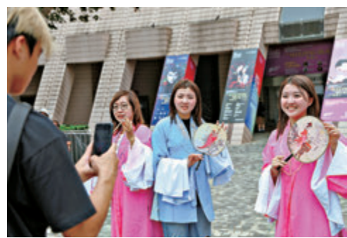
●「非遺嘉年華」吸引不少市民及遊客到訪。

香港文匯報訊（記者 張茗）為「香港非遺月2026」揭開序幕的「非遺嘉年華」，前日起一連兩天（5月30日至31日）在香港文化中心露天廣場舉行，巡遊表演精彩緊湊，富有創意的市集更是琳瑯滿目，吸引不少市民及遊客到訪。他們均認為，活動既能親身體驗傳統技藝，又能深入認識香港非遺項目，希望有關部門未來能舉辦更多類似活動，讓非遺傳承。