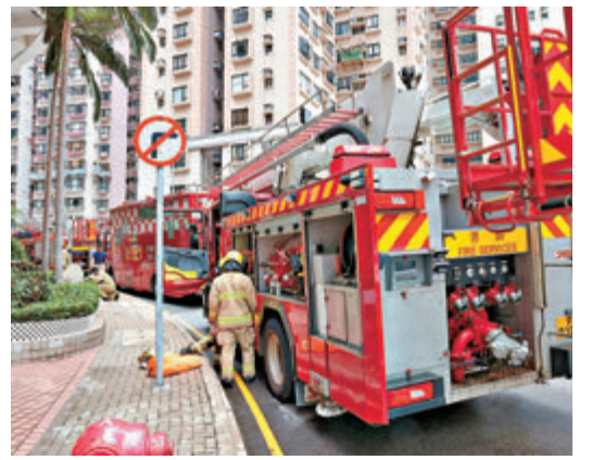
●消防員趕赴現場。