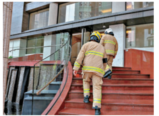
▲▼消防員及警員分別前往事發單位。