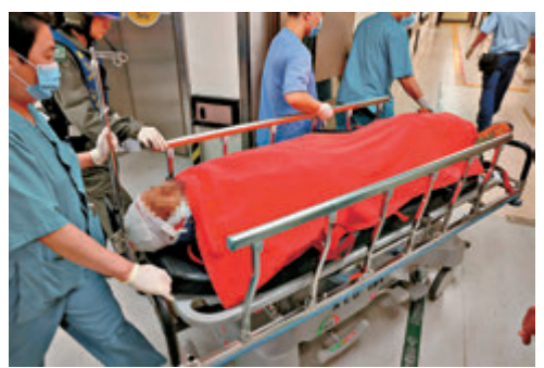
●行山墮澗受傷男子由直升機送抵東區醫院後恢復清醒。