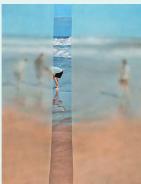
●角谷紀章《Curtain#88》

香港文匯報訊 白石畫廊正呈現雙人展「對倒」，匯集兩位新時代日本藝術家——原澤亨輔和角谷紀章的作品，展期直至7月4日。