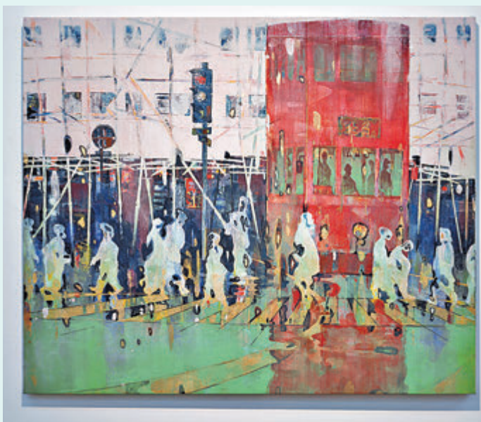
●原澤亨輔《Tram and Bamboo》

原澤亨輔2018年考入東京藝術大學美術學部繪畫科日本畫專科。在校期間即嶄露頭角，先後獲「KENZAN」展新生堂獎(2019)、安宅獎(2020)及「美之舍學生選拔展」優秀獎(2021)，並於三年級時舉辦了首場個展。2022年，他升入東京藝術大學研究生院美術研究科繪畫專業日本畫研究領域(神