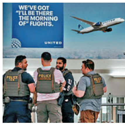
●美海關人員在機場站崗。

美國部分地方政府尤其民主黨主政的城市，傾向採取對移民相對包容的立場，通過地方法律或政策，限制地方執法部門與聯邦移民機構合作，旨在降低非法移民對遭驅逐出境的恐懼。實施這些政策的城市通常被統稱為「庇護城市」或「庇護轄區」。