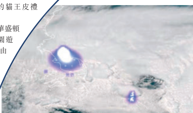
●衛星影像顯示流星在波士頓附近大氣層爆炸。

香港文匯報訊 據美國媒體5月30日報道，美國東北部馬薩諸塞等州份多地居民當天聽到巨響，引發恐慌。初步判斷可能由一顆流星進入大氣層產生音爆所致，目前沒有相關傷亡、損失或公共安全威脅報告。 報道說，巨響發生在當地時間下午2時過後，馬薩諸塞州東部、羅得島州、新罕布爾州等多地均有居民報告聽到類似的爆炸聲。美國流星協會說，巨響可能由一顆直徑約0.9米的流星，在新罕布爾州與馬薩諸塞州交界線附近進入大氣層引發。