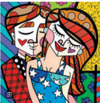
Romero Britto 作品。