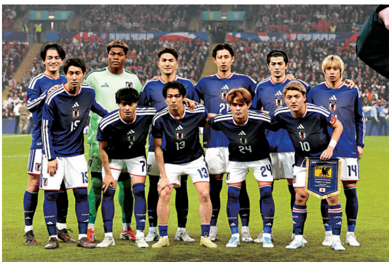
●日本近年曾多次擊敗世界級勁旅。 資料圖片

日本隊自2022年起曾連連擊敗德國、巴西及西班牙，今年三月更在溫布萊球場以1:0擊退英格蘭，反映出森保一靈活切換主動進攻與低位防守反擊的戰術，已具備與世界頂尖強隊抗衡的實力。