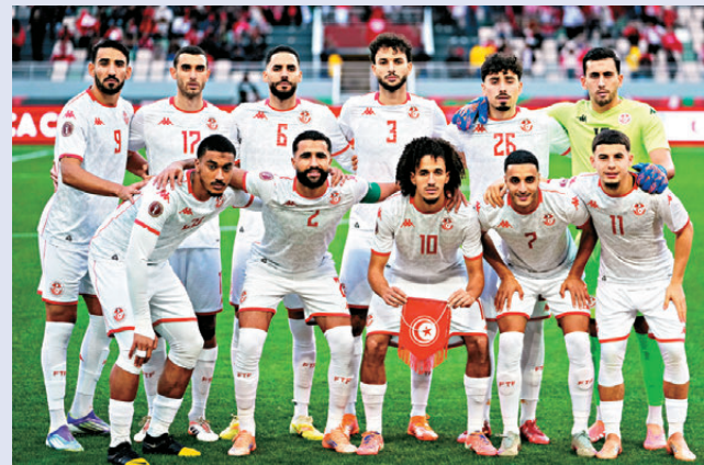
●突尼西亞的賽績水平惹起球迷質疑。