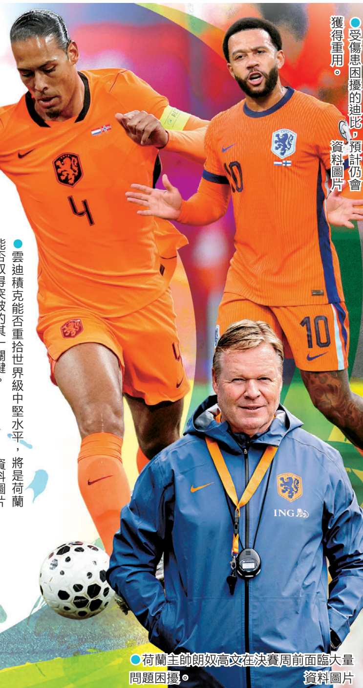
●雲迪積克能否重拾世界級中堅水平，將是荷蘭能否取得突破的其一關鍵。 資料圖片

朗奴高文治下的荷蘭隊踢法更趨務實與耐心，告別了過往內訌與混亂的惡名。橙軍既能大打控球，亦能甘願交出控球權，利用後防英超球員的長傳配合加普在邊路發動快速反擊。在世界盃擴軍、分組賽容錯率提高的新制下，荷蘭隊首戰對陣「強隊殺手」日本將是小組首名爭奪的關鍵。只要憑藉穩健的防守防線步步為營，縱使雙核狀態不妙、傷兵滿營，實用主義至上的「橙衣軍團」仍有機會在群雄並起的決賽周中，憑藉防守反擊戰術走得更遠。