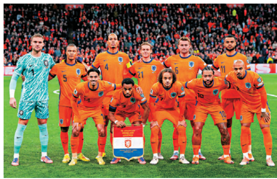
●荷蘭希望首度贏得世界盃冠軍。

防線中軸核心不復當年之勇，進攻端的重心加普同樣令人擔憂。加普效力的利物浦在剛過去的球季表現令人失望，雖然他是陣中少數表現較正常的球員，但受到球會整體低迷的氣氛拖累，他近期的進攻效率與門前把握力均出現