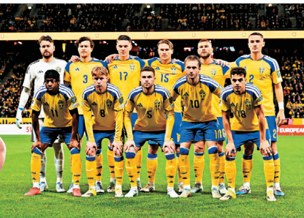
▲瑞典透過附加賽晉級決賽周。