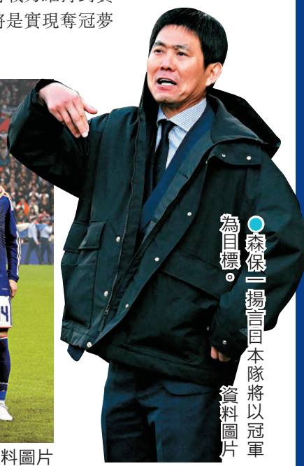
●森保一揚言日本隊將以冠軍為目標。

日本隊今屆首戰對陣荷蘭將是爭奪小組首名的關鍵戰，預計出線難度不大。然而，日本隊過去從未突破世界盃16強，陣中缺乏高效純中鋒亦可能削弱淘汰賽拉鋸戰中的反擊效率。這支實力之師能否打破「16強魔咒」並將戰力維持到賽事後半段，將是實現奪冠夢想的關鍵。