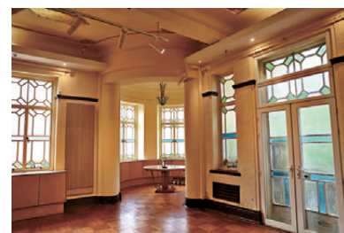
▲虎豹別墅內部，融合中西文化元素。