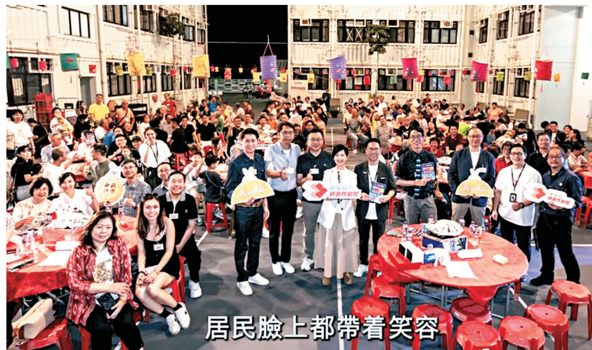
●何永賢強調，未來會繼續發揮過渡性房屋作為社會安全網的重要作用。

有受惠居民在影片中分享指，第一眼看見過渡性房屋單位就很開心，「因為這裏有窗，住了十多年劏房，都未試過住有窗的地方。」有居民讚地方