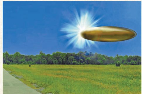
●FBI實驗室根據目擊者口述、聲稱的銀色膠囊狀物體示意圖。網民諷刺稱「看上去像是一顆魚油膠囊P在Windows XP壁紙上。」

其他正常活動。主流科學界亦普遍持謹慎態度，認為部分案例可能與氣象現象、傳感器誤差或人為誤判有關。