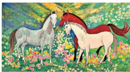
《愛與自由的花園》之五紙本設色 180cmx97cm。(2026年) 作者畫作

朝夕相伴，我與91級美術專業班的同學們結下了純粹又深厚的師生情誼。時至今日，回望這段扎蘭屯師範、以藝育人的從教歲月，心中依舊滿是溫暖、幸福與懷念。