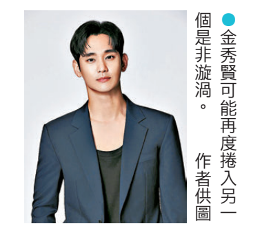
● 金秀賢可能再度捲入另一是非漩渦。

在這剝花生成蠶的世道，謠言不會止於智者，只會細菌分裂置人於死地，大眾的眼睛再雪亮也會被AI蒙騙。所以大家雖非名人，但也要小心被採樣探聲，利用AI技術用來騙人。 這邊金世義遭起訴，金秀賢眼見可以重見天日，奈何另一邊已故女星雪莉的哥哥近日稱手中握有對金秀賢不利的錄音檔，讓金秀賢再度被捲入是非漩渦，金秀賢再次躺着中槍，為什麼？看他的生日日期就知道，因他帶有躺着中槍的磁場。