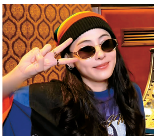
●張柏芝不改鬼馬本色。

香港文匯報訊 (記者 阿祖) 張柏芝昨日攜手華納音樂中國，正式推出加盟後首支個人單曲《長大的那天》，作品選在6月1日國際兒童節同步上線，作為一份特別的節日禮物。她以飽含故事感的嗓音，演繹這首「寫給孩子，也寫給時間的歌」，用音樂定格成長、告別與相守的溫暖點滴。