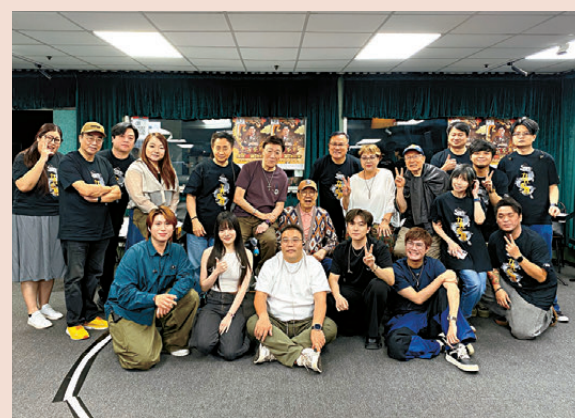
●眾人齊撐胡楓紅館騷。

此外，提到他自爆想剃光頭，他稱入行前便已將其列入人生清單，認為可能帶來啟發，若日後需要強烈靈感或遇到光頭角色也會考慮，但目前創作狀態良好，尚未需要此舉。