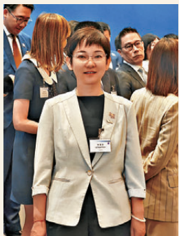
●李冠華 香港文匯報北京傳真