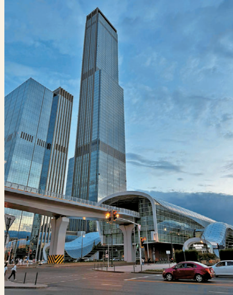
●哈薩克斯坦首都阿斯塔納的街景。

理想汽車自2025年年中正式啟動「出海」業務，並將中亞市場列為全球化戰略的首要布局區域。李冠華談到，本次大規模商貿外訪旨在挖掘「一帶一路」沿線市場機遇，深化區域間經貿交流合作。藉助政府層面的對接渠道，理想汽車能夠在國際市場競爭加劇前快速建立品牌認知，將初期市場熱度轉化為長久的用戶品牌忠誠度。