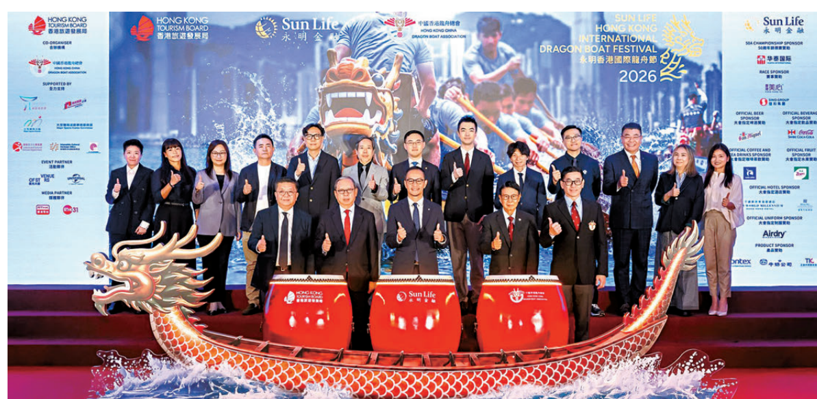
●香港旅遊發展局推出全新推廣「香港夏日盛會」，打響頭炮的將是香港國際龍舟節。

龍舟節設有非遺工作坊，讓市民旅客體驗編織漁網、吹糖及製作灰水糰，現場亦可透過虛擬實境（VR）感受龍舟競渡。周末及公眾假期，啤酒樂園