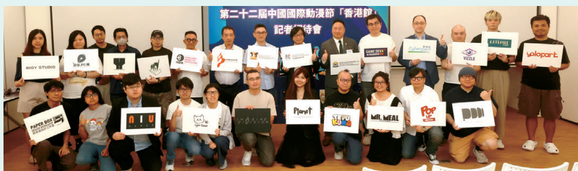
●香港數碼娛樂協會將於本月及10月，分別在杭州的中國國際動漫節及廣州的中國國際漫畫節動漫遊戲展，以「潮遊動漫」為主題設立香港館。