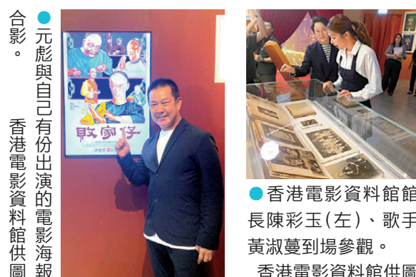
●元彪與自己份出演的電影海報合影。

香港文匯報訊（記者 文森）為慶祝25周年誌慶，康文署香港電影資料館將於今日（3日）至明年3月29日，在香港文化博物館舉行「幸會25歲——香港電影資料館珍藏展」，免費入場。珍藏展展出近千項資料館歷來搜集、修復和保存的電影文化瑰寶，當中有逾百項更是首次展出，以呈現香港電影歷久不衰的非凡魅力，同時回顧資料館四分之一世紀以來傳承香港電影文化的工作。