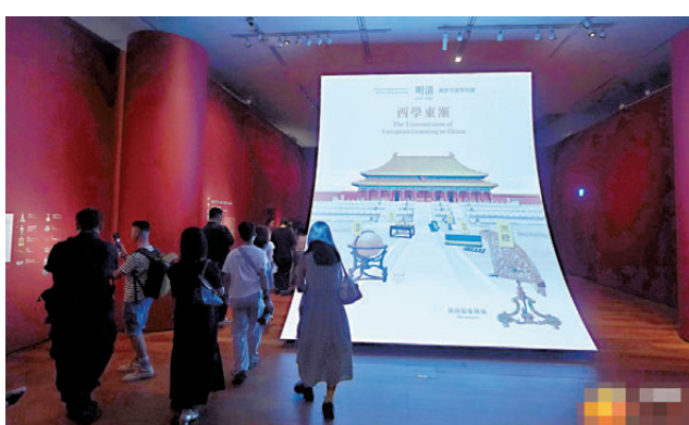
●香港故宮文化博物館今日起舉辦「香港賽馬會呈獻系列：紫禁城看世界——中外文化交流與互鑒」。

是次展覽分為4個單元，包括「中外往來——馬可字羅與鄭和」、「舶來珍品——明代宮廷藝術與世