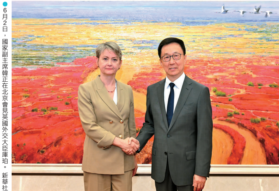
6月2日，國家副主席韓正在北京會見英國外交大臣庫珀。