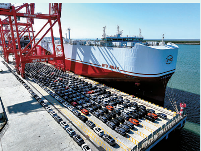
●受中東局勢持續緊張、國際油價上漲影響，全球電動汽車銷量持續攀升。圖為5月31日，裝載7,273輛新能源汽車的比亞迪「濟南號」滾裝船從江蘇南通港啟航外銷。新華社

另據新華社引述《日本經濟新聞》網站報道，受中東局勢持續緊張、國際油價上漲影響，全球電動汽車銷量持續攀升。標普全球交通出行公司發布的報告顯示，今