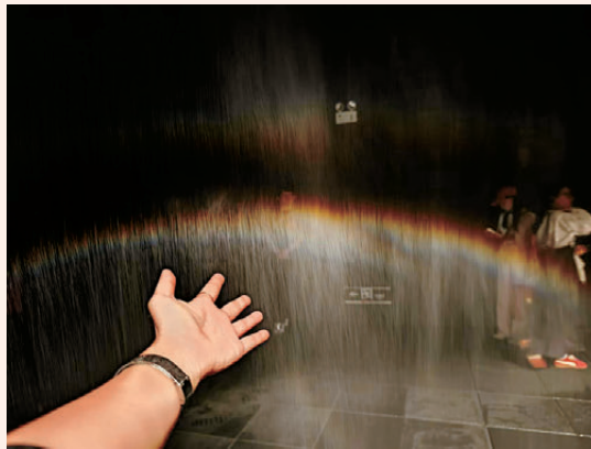
●奧拉維爾·埃利亞松互動作品《聚合彩虹》