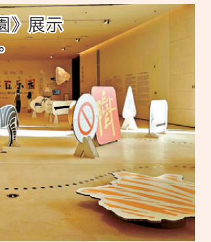
●特展《徐冰：字在樂園》展示徐冰各階段經典代表作。