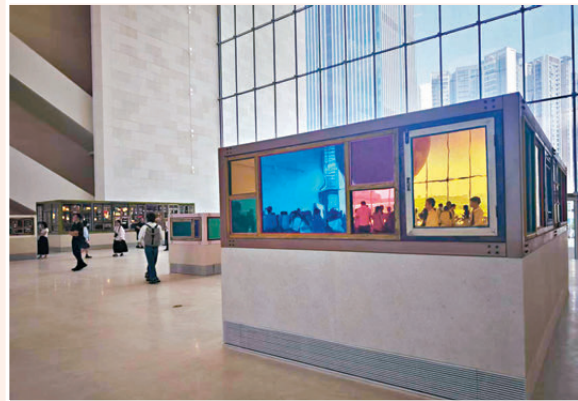
●宋冬作品《世界之窗》