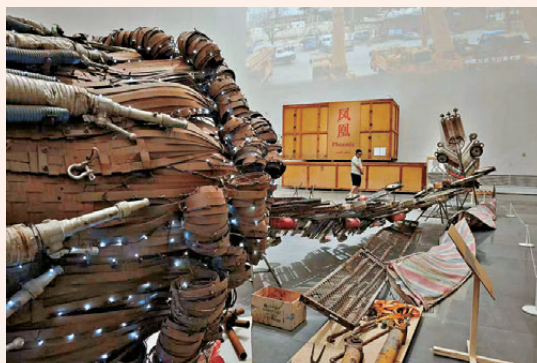
●徐冰代表作《鳳凰》首次落地平放展出。