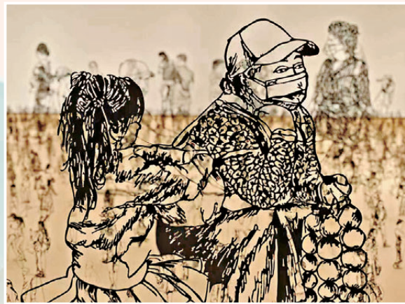
●扎多克·本·大衛作品《我見過但從未謀面的人》