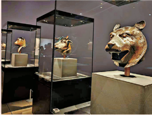
●《國寶歸來》集結多尊圓明園獸首，其中4尊為原件。