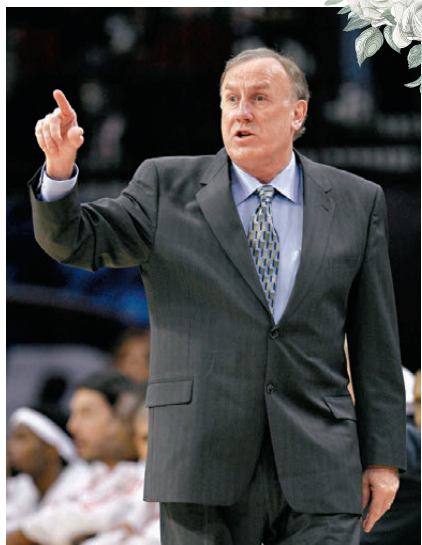
●NBA一代名帥艾德曼逝世，享年79歲。

榮譽方面，艾德曼於2021年正式入選奈史密斯籃球名人堂，並在2023年獲頒「查克戴利終身成就獎」，此