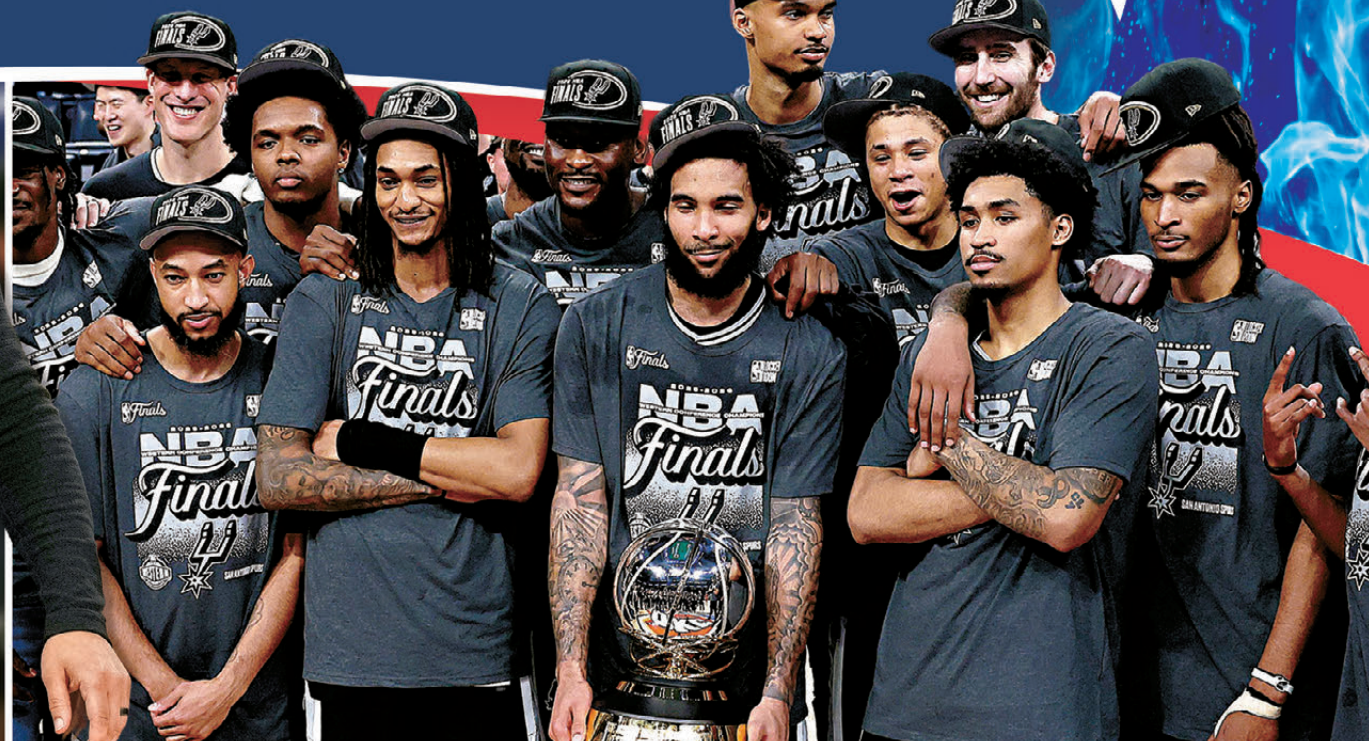
▼馬刺在新帥帶領下，相隔12年重返NBA總決賽。資料圖片