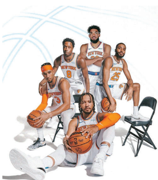
●紐約人的「五星陣容」攻守兼備。

香港文匯報訊（記者 郭正謙）自1999年「老八傳奇」後便與總決賽絕緣的紐約人，睽違27年終於再度叩關NBA總決賽。他們將於香港時間明日（4日）早上8時30分作客聖安東尼奧，展開終結53年冠軍荒的挑戰之旅，雖然外間稱為看好擁有「外星人」雲班亞馬的馬刺，不過挾着11連勝之威、以逸待勞的紐約人陣容亦絕不遜色，由有「紐約之王」稱號的賈遜、「射手」中鋒卡爾唐斯、祖斯夏特、阿奴諾比及米卡布里斯捷組成的「五星陣容」，有望力抗馬刺這支天才橫溢的年輕軍團。（ViuTV 99台、Now641台周四早上8：30a.m.直播）