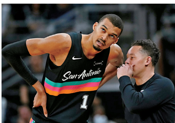
●米奇莊遜（右）「亦師亦兄」風格贏得球員尊重。

馬刺總經理白賴仁韋特更高度評價米奇懂得「讀心術」：「他天生懂得理解人，知道如何激勵和推動球員，同時也懂得如何給予他們尊重和信心。」