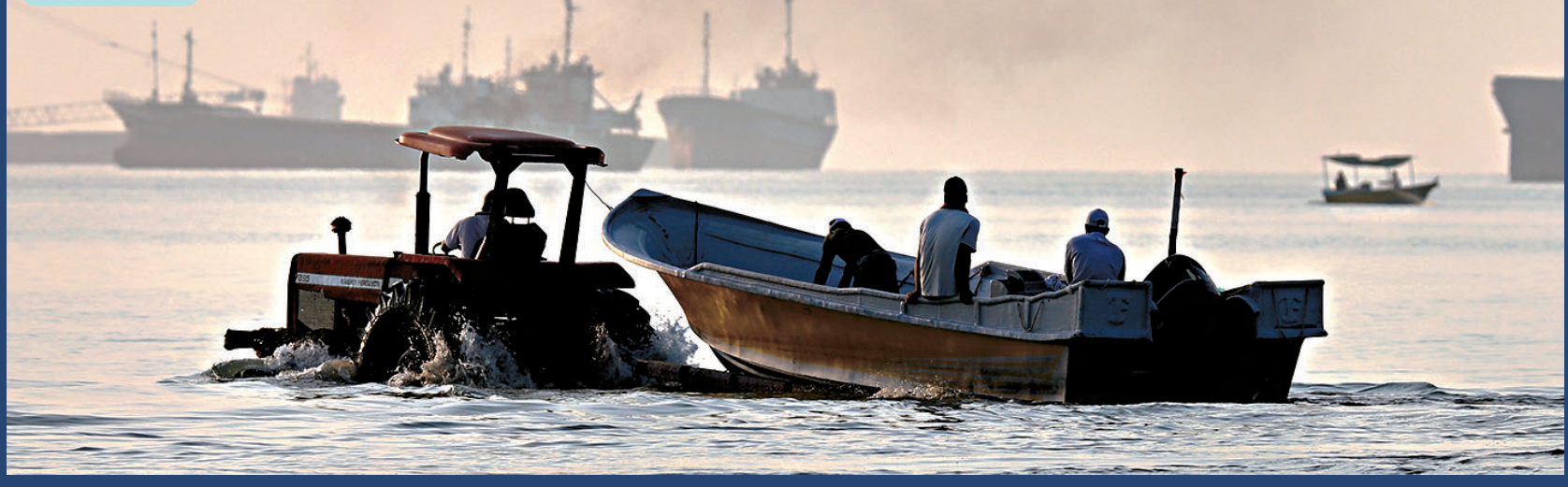
●在伊朗阿巴斯港附近的霍爾木茲海峽，一艘小船穿過淺水區。

香港文匯報訊 美國與伊朗就停火協議談判進度說法不一。伊朗傳媒1日表示，由於以色列持續在黎巴嫩等地開展軍事行動，伊朗談判團隊已暫停同美國對話，計劃徹底封鎖霍爾木茲海峽。美國總統特朗普則表示，他認為未來一周內將與伊朗達成協議，以延長停火期限、重新開放霍爾木茲海峽。