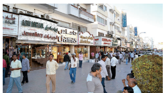
●美國威脅對阿曼發動空襲。

分析也指出，相較多數海灣國家，阿曼石油產量偏低、經濟實力較弱，難以依靠軍事合約及大型商業合作，在美國政壇形成話語權。如今在美