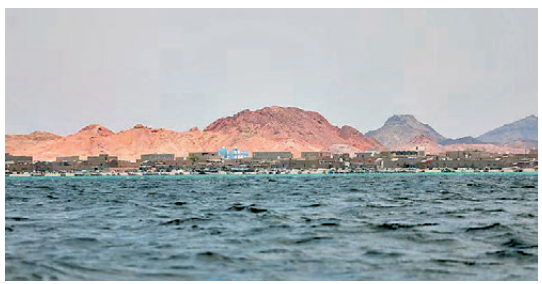
●曼德海峽位於紅海南端。

該消息人士表示，伊朗官員和談判代表已提出，要求以色列立即停止在黎巴嫩和加沙地帶的軍事行動，並從以方控制的黎巴嫩相關地區全面撤出。作為「懲罰以色列及其支持者的選項」，伊朗和「抵抗陣線」計劃徹底封鎖霍爾木茲海峽，且不排除在另一能源運輸要道曼德海峽等其他戰線開啟行動。