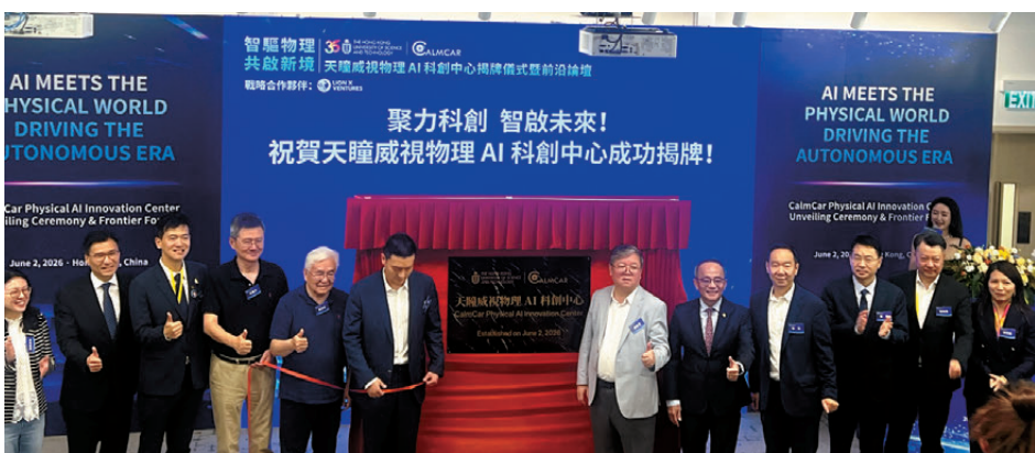
●天瞳威視物理AI科創中心昨揭牌。

港科大計算機科學及工程學系講座教授、物理AI科創中心主任郭高詳細闡述了中心的技術路徑。當前強大的機器智能仍被「鎖在數字世界中」，雖然已使生產效率提升上百倍，但下一個關鍵突破點在於讓AI走出虛擬空間，真正理解、預測並作用於物理世界。「這不僅是時代的呼喚，更是國家戰略、香港定位與我們使命的同頻共振。」