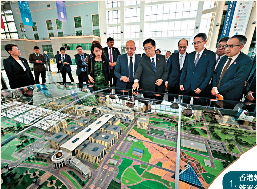
●李家超到訪哈薩克斯坦阿斯塔納納扎爾巴耶夫大學。圖為李家超參觀校園。