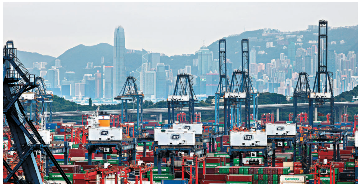
●標普全球昨公布，5月香港PMI升至50.4，重返擴張區間。分析指短期內出口仍是拉動香港經濟增長重要動力。圖為香港貨櫃碼頭。

香港私營經濟於5月回復景氣。標普全球5月香港採購經理指數（PMI）顯示，出口貿易穩健增長，新訂單量輕微上升，惠及經營活動3個月以來首度擴張，PMI由4月的48.6升至50.4。業務情緒雖然仍悲觀，但已淡化至3個月最低。報告指出，綜觀最近一個調查月，香港私營企業的經營活動自今年3月以來首度擴張，惟增長溫和，也遠遜於今年年初升勢。行業數據顯示，5月以建築業的產出表現獨領風騷，其餘四大行業均見減產。