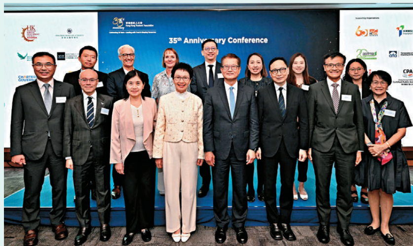
●財政司司長陳茂波昨出席香港信託人公會35周年會議。

香港文匯報訊（記者 馬翠媚）香港日前擊敗瑞士在全球跨境財富管理中心稱冠，同時在全球金融中心指數排名中追貼紐約及倫敦，「反超前」相信指日可待。連日馬不停蹄為香港「省視招牌」的特區政府財政司司長陳茂波，昨出席香港信託人公會35周年會議時明言，信託業是守護本港金融安全「不可或缺的制度性基建」，隨着環球資本重組、創科浪潮與國家雙向開放三大趨勢疊加，行業將迎來結構性增長的黃金機遇，認真有「運」行。