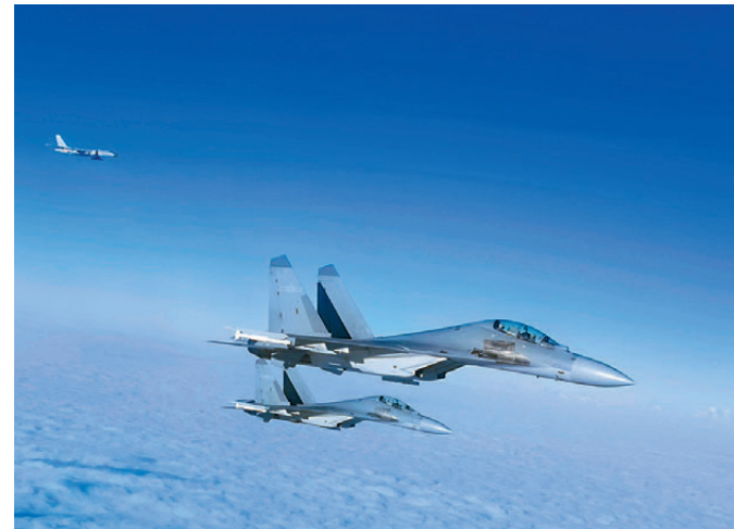
▲早前，在「正義使命-2025」環台演習中，東部戰區空軍多型多架攔擊機、轟炸機編隊飛赴台島南北兩端相關海空域開展演練。資料圖片