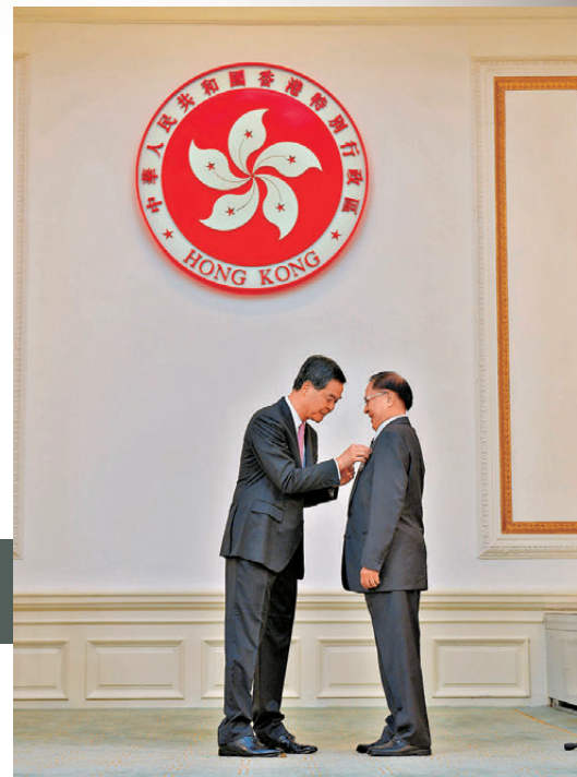
●鍾景輝於2013年獲頒授銀紫荊星章。

香港戲劇界殿堂級大師鍾景輝昨早在家中安詳離世，享年89歲。被尊稱為「King Sir」的鍾景輝是演員、導演、戲劇教育家及電視製作人，活躍於舞台劇、電視與電影領域，作品多不勝數。教學方面，鍾景輝倡議開辦藝員訓練班課程，並親任首四期導師，更擔任香港演藝學院戲劇學院創院院長。從舞台到教室，從幕前到幕後，King Sir以大半生心血澆灌香港戲劇土壤，築起香港戲劇基石，成就無數後起之秀。大師安然謝幕，演藝界滿載哀思，眾多門生與影迷緬懷其風骨與恩澤。