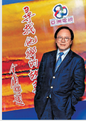
●鍾景輝為《尋找他鄉的故事》系列擔任旁白。

對於人生與老去，鍾景輝曾留下令人動容的感悟：「我不怕老，一直老，便能一直成長，一直學習。一片樹葉也待落葉的時候，才能發放出最燦爛的色彩。人生真是很美好的，因此我會用有限的時間做最多的事。」他以從容與智慧看待生命的每個階段，正如他一生對藝術的執著與熱愛，至晚年仍閃耀餘光。