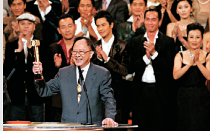
●鍾景輝在2006年獲頒「萬千光輝演藝大獎」。