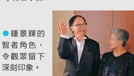
●鍾景輝的智者角色，令觀眾留下深刻印象。

表揚他對香港戲劇藝術發展的卓越成就。此外，他亦獲香港演藝學院頒授榮譽院士及榮譽戲劇博士，並獲香港公開大學及香港樹仁大學頒授榮譽文學博士學位。