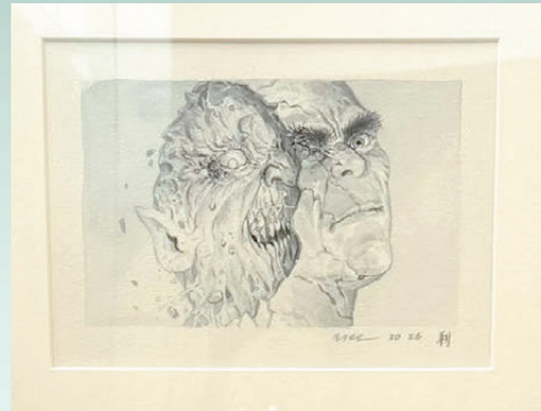
●展覽可見李志達於今年最新創作的作品。