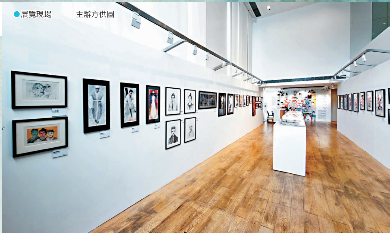
●展覽現場

李志達的作品跨越類型與媒介，從早期獨立漫畫到長篇敘事，始終保持一種不隨波逐流的視覺語言與創作膽識。《二度刺秦宇宙》特別劃分出不同年代與媒材的對話區域，透過逾三十幅原畫手稿，邀請香港觀眾重新走進漫畫家筆下那個蒼茫、暴烈卻又充滿江湖情義的戰國世界。