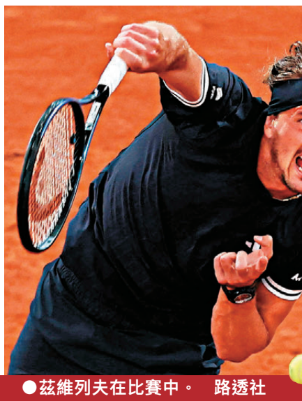
●茲維列夫在比賽中。

香港文匯報訊 據新華社報道，男單奪冠熱門、二號種子茲維列夫在法國網球公開賽上順利晉級四強。