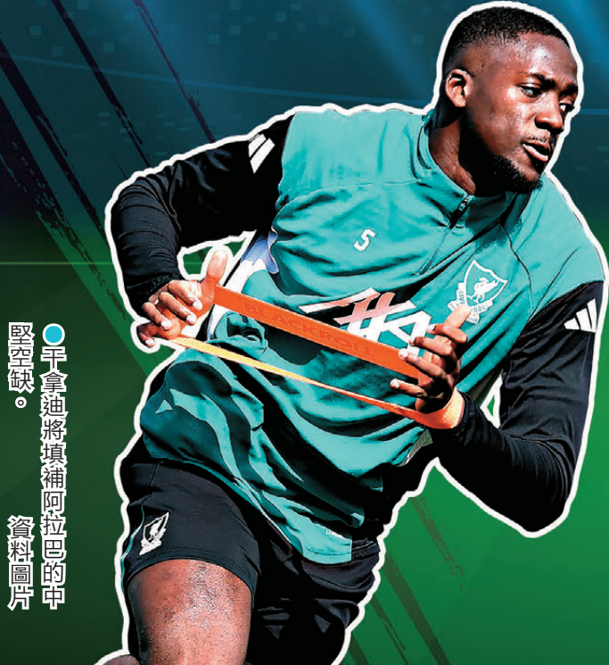
艾達臣將填補阿拉巴的中堅空缺。資料圖片