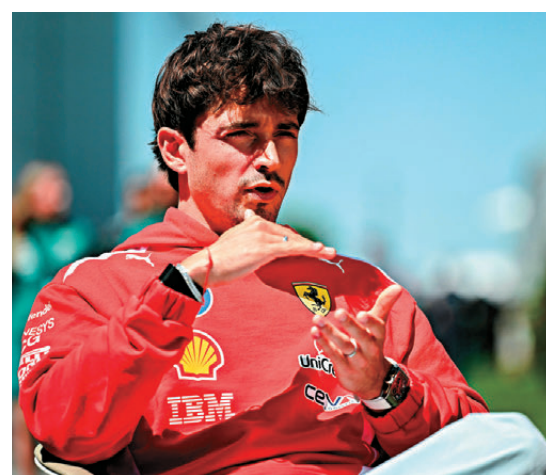
●勒克萊將留效法拉利車隊。

也共同面對過一些艱難的挑戰，但我比以往任何時候都更加相信這支車隊，我由衷地感謝我們能夠繼續並肩作戰，朝着世界冠軍的目標不斷努力。」