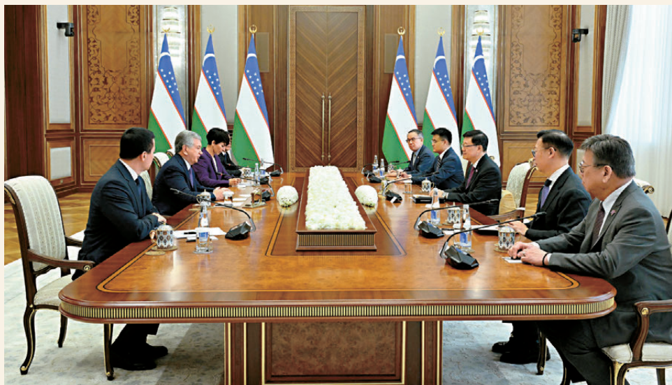
李家超在烏茲別克斯坦塔什干與烏茲別克斯坦總統沙夫卡特·米羅莫諾維奇·米爾濟約耶夫會面。