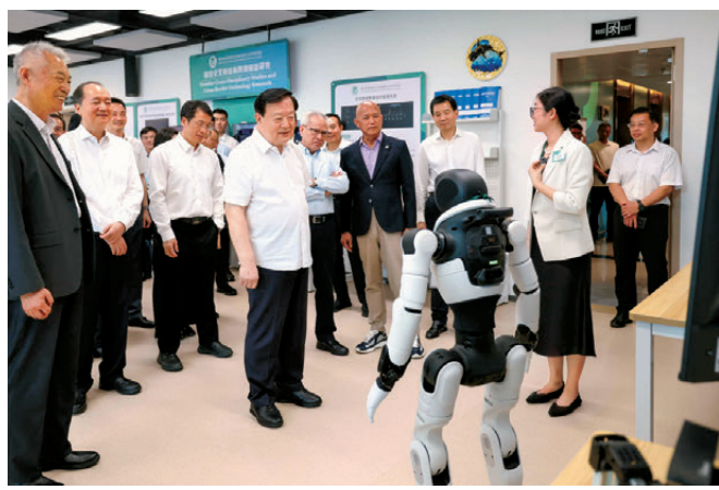
夏寶龍在澳門城市大學高等研究院調研。

香港文匯報訊 據中共中央港澳工作辦公室、國務院港澳事務辦公室網訊，2026年6月1日至4日，中央港澳工作辦公室主任、國務院港澳事務辦公室主任夏寶龍在橫琴粵澳深度合作區、珠海市，圍繞支持香港、澳門主動對接國家「十五五」規劃，深度參與粵港澳大灣區建設，更好融入和服務國家發展大局進行調研。