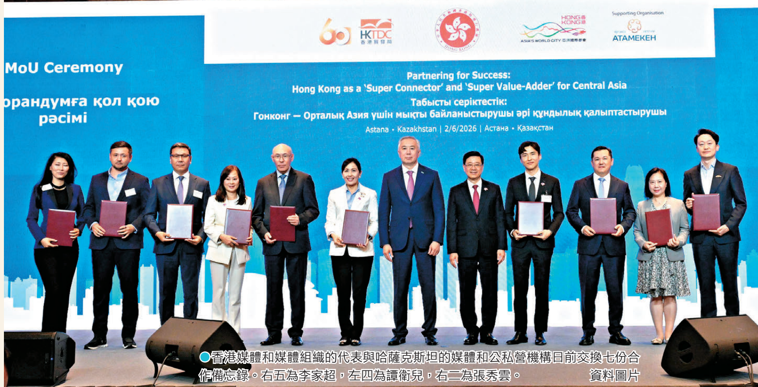
●香港媒體和媒體組織的代表與哈薩克斯坦的媒體和公私營機構目前交換七份合作備忘錄。右五為李家超，左四為譚衛兒，右二為張秀雲。