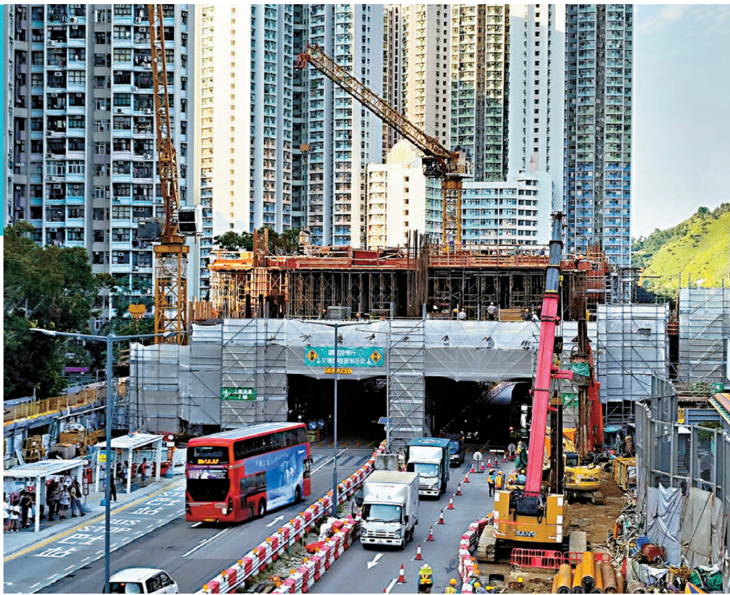
●正在動工興建的天水圍街市。

政府認為，各種模式在不同情況各有長短，但整體承租模式街市着實有令街市煥然一新的例子，亦獲正面評價。政府留意到本港目前採用整體承租模式的街市由多個承租商營辦，市場不乏競爭。