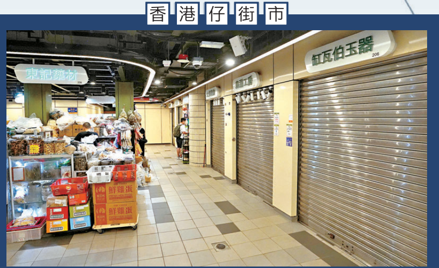
▲街市2樓有不少店舖拉開。