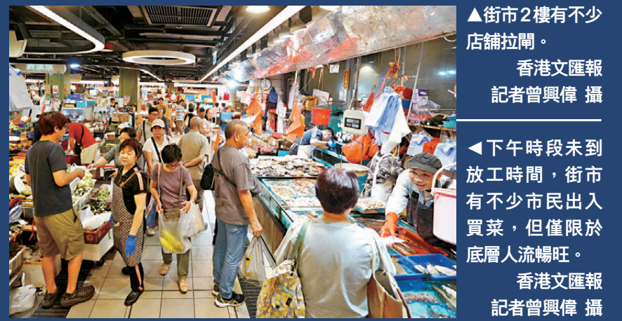
◀下午時段未到放工時間，街市有不少市民出入買菜，但僅限於底層人流暢旺。

新街市物價較高，會寧願跨區買平靚，「加上好多商販我哋都買慣買熟，由佢哋開（檔）就一直幫襯佢地。一旦新街市租金高，我怕好多商販都無能力搬過去。」