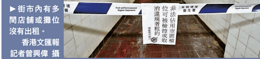
▶街市內有多間店舖或攤位沒有出租。