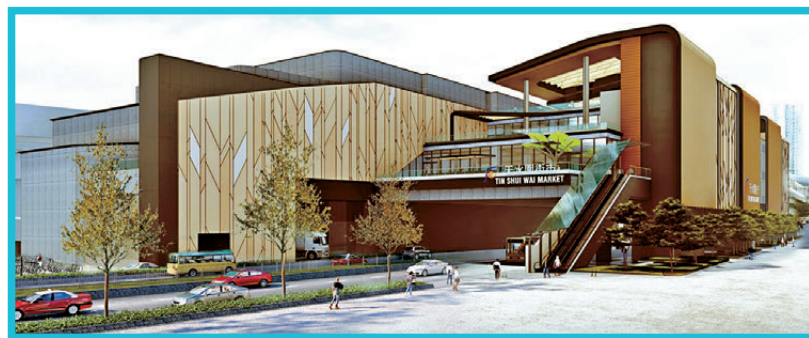
●天水圍街市構想圖。 元朗區議會文件

香港文匯報訊（記者 崔灃）政府向立法會提交的文件，詳述目前食環署轄下公眾街市均由其直接管理的問題所在，以及引入新管理模式的理據和必要性。文件指出，由署方直接管理的方式，其在挑選租戶、設定租金水平、調整租金、改變行業組合、處理續約及終止租約等方面，往往受較多限制，難以如私營機構般快速靈活地應對不斷轉變的市場需求。