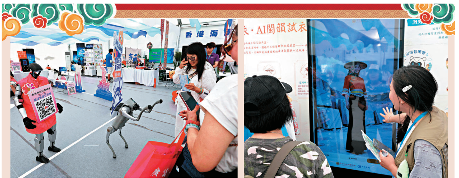
●智能機械狗與機械人

現場還有三大AI互動設備成為人氣焦點，包括閩南語互動機，讓市民跟讀並感受閩南語的獨特韻味；AI生圖換裝機，即時生成身穿閩地特色服飾的虛擬圖像；AI旅遊規劃機，以人格測試為基礎，為市民個性化推薦福建的隱藏旅遊景點與精彩玩法。