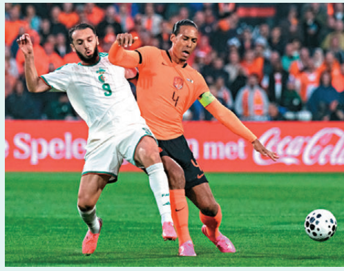
●荷蘭(橙衫)於熱身賽爆冷不敵阿爾及利亞。

荷蘭主帥朗奴高文坦言對球隊把握力感到不滿：「馬倫今場至少應該入一球，他總能在正確時間出現在正確位置，我不會懷疑他的能力，但他在羅馬的表現的確比今場好。」不過他亦讚揚首次披上荷蘭球衣的翼鋒森馬維值得入選世界盃大軍名單，認為此子能夠在進攻上帶來不同變化，相信他會愈踢愈好。