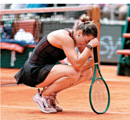
●薩巴倫卡於法網八強意外落敗。

薩巴倫卡落敗後甚至說出了「我現在只想退出網壇」的晦氣話，她坦承自己太想在法網奪冠導致情緒失控：「我太執着於自己沒贏過法網冠軍，情緒變得