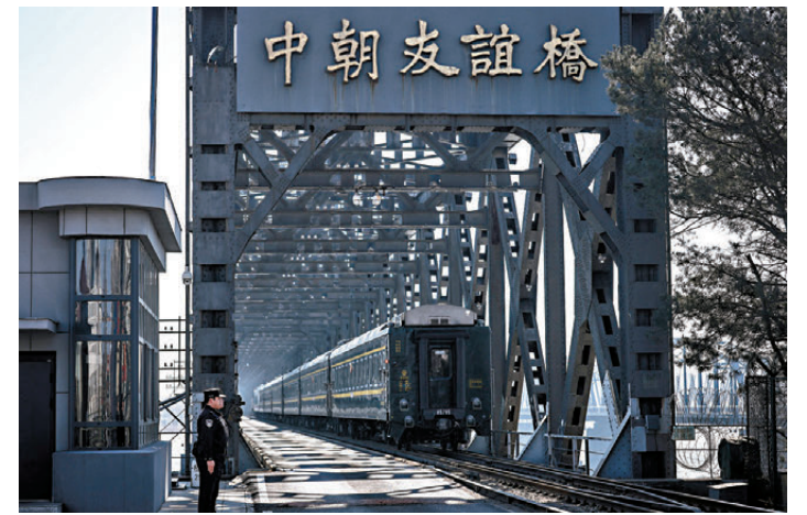
▲自2026年3月12日起，中國北京、丹東至朝鮮平壤間雙向開行國際旅客列車，進一步促進中朝兩國人員往來、經貿合作和人文交流。 資料圖片