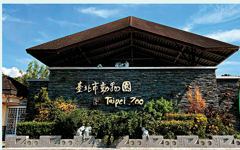
●台北市立動物園外觀。網上圖片

蟲，健康狀態符合轉運要求。為了確保轉運順利，上海動物園專家還對他們進行了目標跟蹤、定位、進出運輸籠、採血脫敏等行為訓練，訓練過程中兩隻小熊猫配合度高、參與積極性好，均順利達成預設訓練目標。