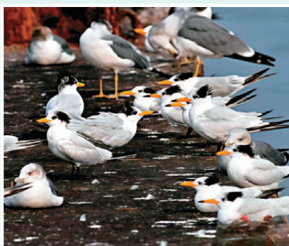
●香港文匯報記者張帆及《經濟動物學報》公眾號