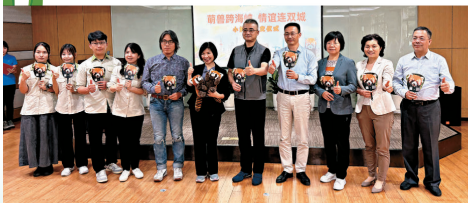
●上海動物園贈送台北市立動物園兩隻小熊猫移交儀式5日在滬舉行。