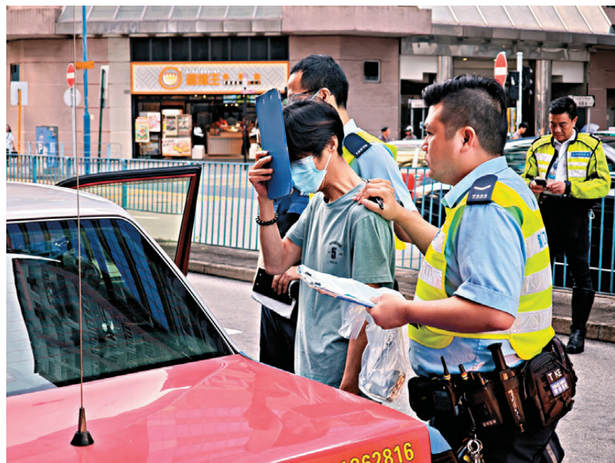
●53歲姓李男的士司機涉嫌「毒後或藥後駕駛」被拘捕。

仔）、甲基安非他明（俗稱「冰」）、大麻、可卡因，及3,4-亞甲二氧基甲基安非他明（俗稱「搖頭丸」），不論駕駛能力有否因而受損，即屬違法。違例者最高可罰款2萬5千元及監禁3年，如屬首次定罪，會被停牌不少於兩年，再次定罪則會被停牌不少於5年。