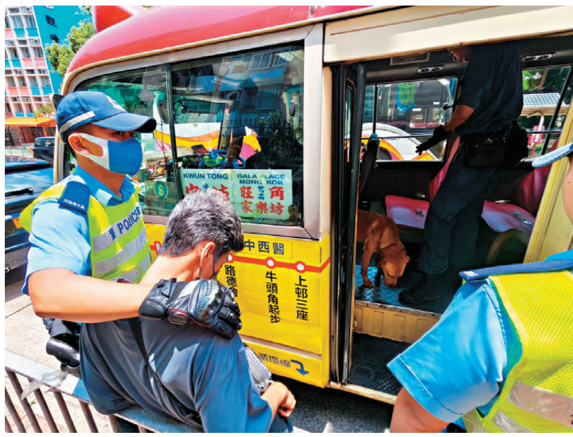
●56歲姓許小巴司機目光呆滯，涉嫌毒後駕駛被捕，緝毒犬上車搜查。

為有效地打擊毒駕及藥駕，政府引入更嚴厲的措施，在2011年修訂《道路交通條例》（第三十七章），《條例》增訂「零容忍罪行」，任何人駕駛時若血液或尿液含有任何濃度的「指明毒品」，即海洛因、氯胺酮（俗稱「K