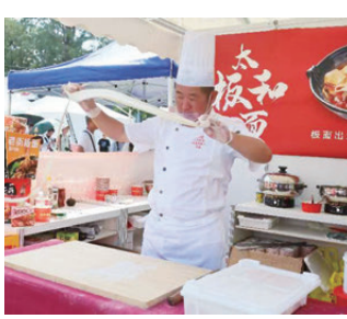
師傅現場製作太和板面。

在熟食區內，太和板面的現場拉製表演引來不少市民駐足拍照。師傅將麵團反覆摔打拉抻，瞬間變出寬厚筋道的麵條，熱氣升騰的板麵湯汁醇厚，現場香氣四溢，為現場市民帶來視覺與味覺的雙重盛宴。許多香港市民排隊嚐鮮，大讚麵條筋道、湯底香辣過癮，讓這道安徽非物質文化遺產在香港瞬間圍粉無數。