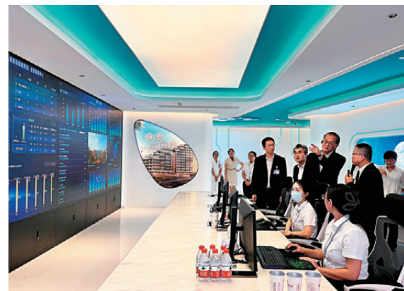
盧寵茂率領代表團在泉州參觀晉江市醫院。