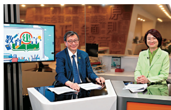
李慧琼日前接受香港大公文匯傳媒集團與香港教育大學聯合出品的《教育建言》節目專訪。

動掌握國家「十五五」規劃的發展方向，將個人未來發展與國家需求緊密結合，透過服務國家所需，自然轉化為強國建設的參與者與貢獻者，最終成為受益者與推動者。