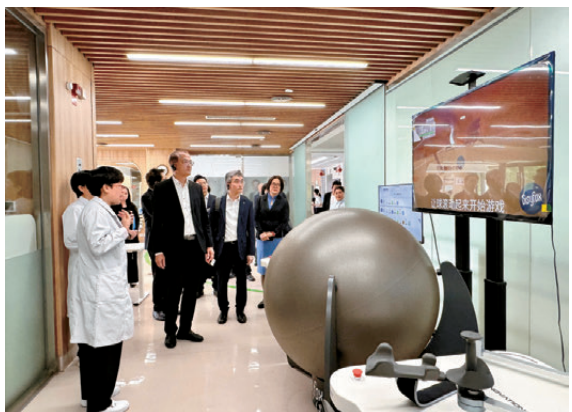
盧寵茂參觀復旦大學附屬華山醫院福建醫院。

此外，代表團在福州、泉州和廈門訪問期間，分別到訪復旦大學附屬華山醫院福建醫院、晉江市醫院和廈門大學附屬中山醫院，實地了解當地醫院的整體運作情況，包括基層醫療和慢性疾病管理體系、中醫服務，以及門診和急診流程等。 陪同盧寵茂出訪的代表團成員包括醫務局副秘書長麥震宇、高級顧問（局長辦公室）樊敬文醫生，以及醫衛局、衛生署和醫院管理局人員。