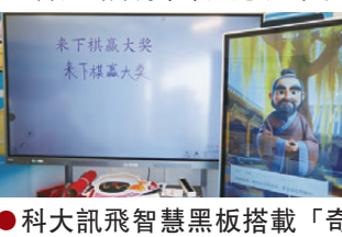
科大訊飛智慧黑板搭載「奇思妙問好奇窗」，向香港民眾展示未來新式科教產品。

香港安徽聯誼總會於主會場旁邊的草地亦設有科技互動攤位，現場展出的產品吸引不少家庭駐足體驗。淘雲科技市場經理譚皓元介紹，棋類互動機器人可切換中國象棋、五子棋兩種模式，單機可與內置AI對弈，聯網後更支援兩台機器遠端線上對戰，「產品適用各年齡層，獨居長者也可下棋解悶，現場不少長者孩童前來體驗。」 科大訊飛工作人員展示了詞典筆與智慧黑板：詞典筆內置詞典，支援繁體掃描及普通話、粵語翻譯，即掃即譯；智慧黑板保留粉筆書寫，兩側副板內容實時同步主屏，內置AI可拆分立體幾何圖形，課後自動生成課堂數據分析。配套「奇思妙問好奇窗」智能問答終端，搭載教育專用大模型及數字人技術，構建愛因斯坦、李白、圖靈等10餘位中外名家AI虛擬形象，以自然語言實時回應孩子提問。工作人員表示，科大訊飛現階段重點拓展香港市場，主攻普通話教學與智慧黑板升級，本次參展意在向香港民眾展示未來新式科教產品。