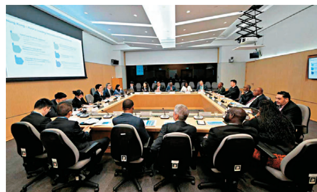
代表團成員一致表示，此訪令人印象深刻，有助於全面了解香港「一國兩制」成功實踐和獨特優勢，願推動本國加強同香港務實合作，助力本國對華關係更好發展。

香港文匯報訊 據外交部駐港特派員公署網訊，5月26日至29日，由外交部組織的非洲、拉丁美洲13個國家駐華使節和外交部等部門高級別官員組成的外國政府官員代表團到訪香港。在港期間，代表團與特區政府主要官員和