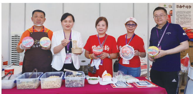
安徽聯總攜淮南特色美食於攤位展出。

由全港30個省級同鄉社團聯合主辦的「第四屆同鄉社團家鄉市集嘉年華」於6月3日至7日一連5天在維多利亞公園隆重舉行。香港安徽聯誼總會連續四年積極參與，今年精心打造熟食區、特產展銷區及科技互動區三大亮點，全方位展現安徽「美食+非遺+科創」的多元魅力。