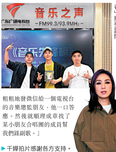
粗粗地發微信給一個電視台的音樂總監朋友，他一口答應。然後就順理成章找了某小朋友合唱團的成員幫我們錄副歌。」

EP中收錄的《小人物》獲主持張宇航點名推介，指歌曲很有愛，與過往認識的「講者」感覺不同。FAT B透露這首歌一直希望找小朋友唱副歌，最終靠一個朋友機緣巧合達成，他說：「我們一直很想找小朋友幫我們唱chorus（副歌），我膽