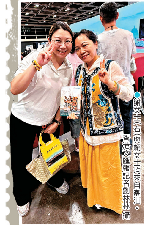
●謝女士（右）與賴女士均來自潮汕。