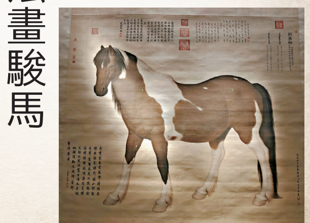
●(清)郎世寧《關虎驢圖》軸

郎世寧用西洋技法畫駿馬 在中國古代書畫史，尤其是清代，有一位西方畫師不能不提，那就是歷經康熙、雍正、乾隆三朝的大利宮廷畫師郎世寧。展廳的另一邊，清代郎世寧的《關虎驢圖》與《摹韋偃牧放圖》遙相呼應。乾隆皇帝特別喜歡戰馬，郎世寧奉命創作了乾隆本人所乘的十四駿馬，名曰《十駿圖》，其中第二軸就是這件巨幅工筆畫作《關虎驢圖》。「關虎驢」的意思是，這匹馬勇猛如老虎。畫作中，馬身棕白相間，鬃毛細而不亂，渲染自然，富有層次，體現了西方高超的焦點透視畫法。兩件採用典型中西方技法的畫作，在文華殿這一歷史空間實現有趣的對望。馬順平透露，畫面上有漢、滿、蒙三種語言標註馬匹信息。但有些數據並不準確。郎世寧在繪畫時應該做了修正，畫中馬的比例非常和諧。