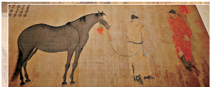
●(元)任仁發《出圍圖》卷局部