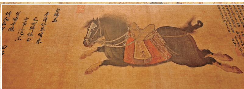
●(金)趙霖《昭陵六駿圖》卷局部之白蹄烏