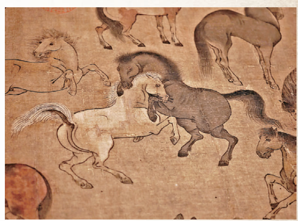
●唐人(傳)《百馬圖》卷局部

今次展覽得到香港賽馬會全力支持，由公益慈善研究院獨家捐助。公益慈善研究院主席黃嘉純表示，故宮是中華文明的瑰寶，在此舉辦展覽以弘揚馬在中國歷史文化中的重要地位，別具意義。適逢丙午馬年，觀眾可藉此盛事，探討馬在歷史與藝術長河中的多重意義。