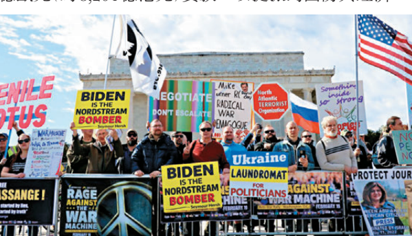
●美國介入俄烏衝突，引發美民眾不滿。

自去年特朗普重返白宮後，其最親密的共和黨盟友包括參眾兩院領導層，對烏態度已明顯降溫。特朗普亦將制裁決策權收歸白宮，而非交由國會決定。同時，歐盟本周同意與烏開啟首輪入盟談判，並批准900億歐元(約8,204億港元)貸款，以提振烏國防與經濟。