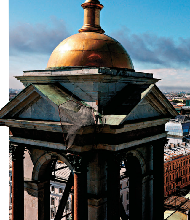
●受烏克蘭無人機襲擊，聖彼得堡冒出濃煙。