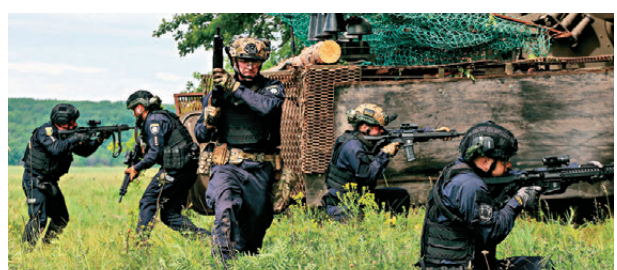
●烏克蘭警員在哈爾科夫接受軍事訓練。

香港文匯報訊 俄羅斯總統普京6月4日在聖彼得堡，會見出席第29屆聖彼得堡國際經濟論壇的13位世界主要通訊社負責人，就俄烏局勢、中東局勢、俄歐關係和俄羅斯經濟等國際及涉俄熱點回答提問。普京表示，俄方準備並願意與烏方以和平方式達成協議。俄羅斯同意按照俄美領袖去年8月在美國阿拉斯加州安克雷奇會晤達成的方案，在烏問題上作出妥協，但前提是烏也準備這樣做。