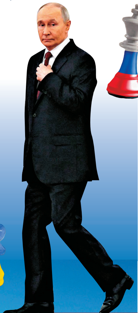
●普京早前在莫斯科克里姆林宮準備會見坦桑尼亞總統。