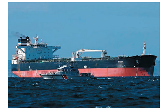
●希臘對俄油禁令持謹慎態度。

北歐國家仍公開支持啟動該海事服務禁令，但作為歐洲重要的航運中心，希臘和馬耳他兩國均對此禁令持謹慎態度。