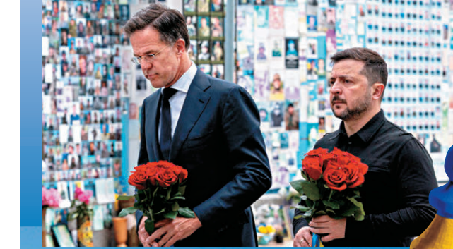
●澤連斯基(右)和北約秘書長呂特在基輔陣亡將士墓前獻花。