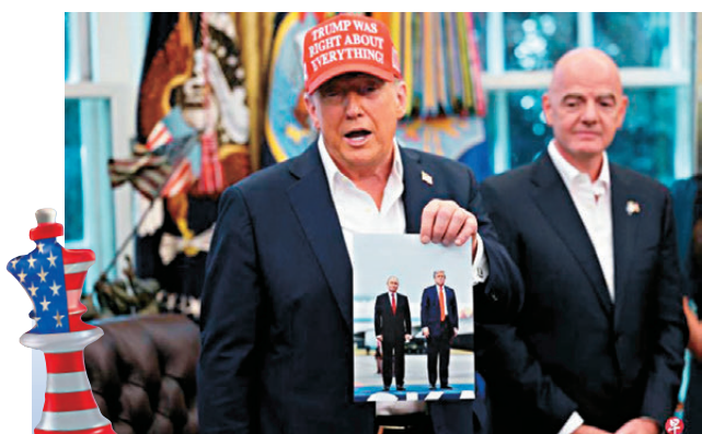
●特朗普早前與普京在阿拉斯加會晤的合照。

澤連斯基表示，去年8月美俄領袖的安克雷奇會晤結果並非定局，烏方認為作為安全保障擔保方，歐洲和美國也應參與俄烏談判進程。烏方準備在談判期間實施全面停火，美國有能力監督。烏俄雙方全面交換戰俘可作為結束衝突的良好開端，不過若普京不認為是時候結束衝突，烏將繼續為生存而戰。克里姆林宮發言人佩斯科夫回應說，普京已獲悉澤連斯基公開信內容。