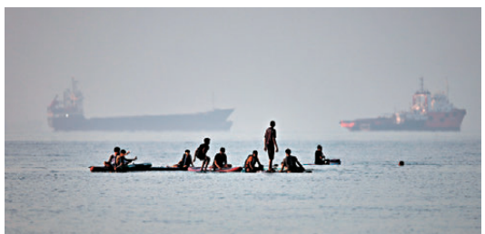
●人們聚集在伊朗阿巴斯港附近的霍爾木茲海峽。

強調相關方案完全符合國際法與海洋法。加里巴巴迪解釋稱，霍爾木茲海峽「完全在伊朗與阿曼的領海範圍內」，兩國為過往船隻持續提供航行引導、安保警戒、海上搜救及海域污染清理等公共服務，收費本質是對相關服務的合理補償且符合國際法，並非違規收取過境費用。他還透露，相關收費框架與細則正在草擬中，並坦言該方案難以「讓某些國家完全百分之百滿意」，但始終堅守合規原則。