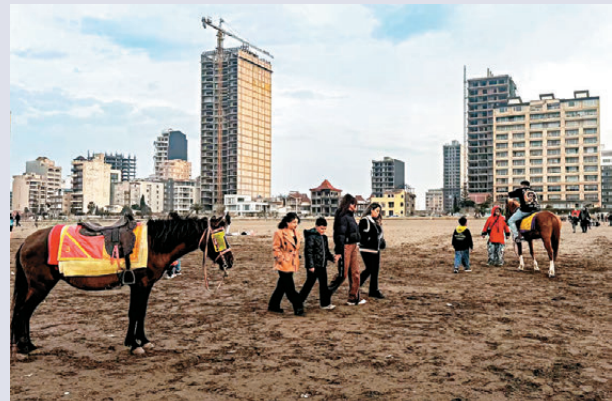
●伊朗近郊地區房產受青睞。

伊朗政治經濟分析師萊茲表示，伊朗經濟長期面對兩位數字通脹率、貨幣失衡和脆弱銀行體系。伊朗家庭一直竭力保衛積蓄，過去一年伊朗貨幣里亞爾兌美元貶值約53%，對低收入家庭的打擊尤其沉重。官方數據顯示，伊朗主要糧食價格過去1年急升，植物油和雞蛋價格急漲逾300%，而雞肉和進口米的升幅亦逾兩倍。