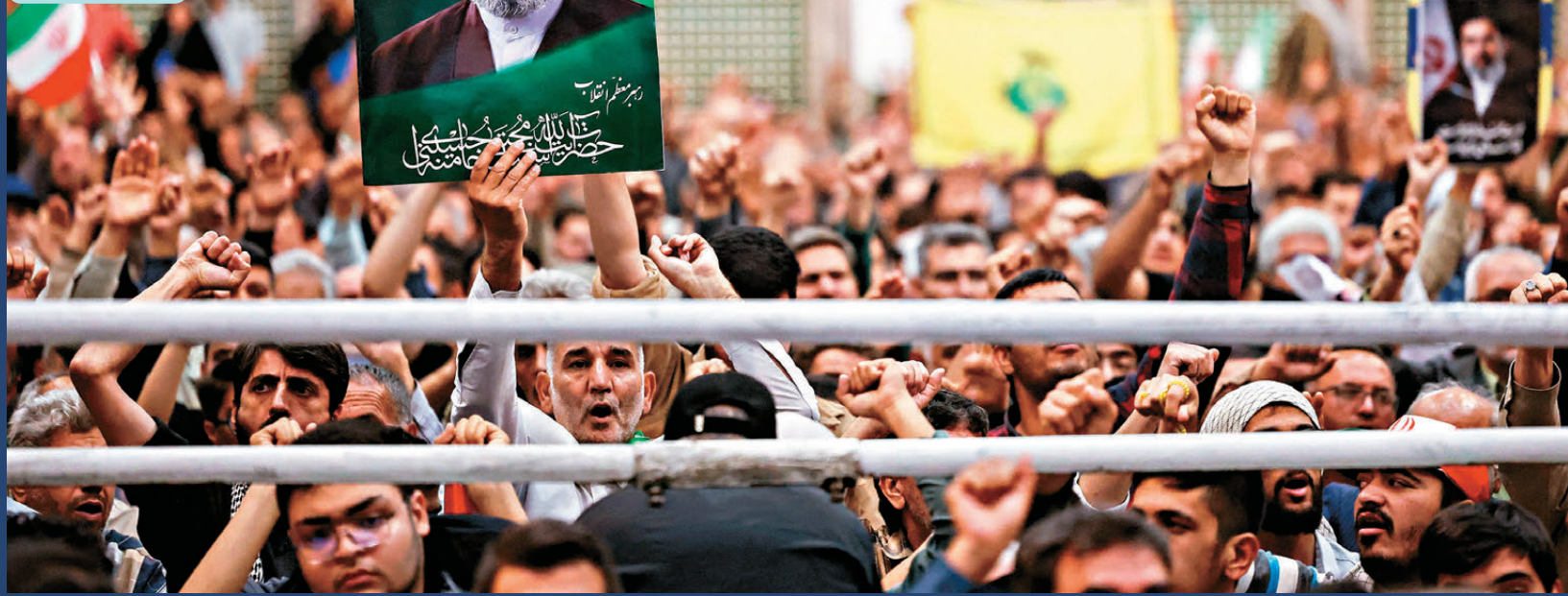
●德黑蘭民眾手持印有穆傑塔巴畫像標語，參加紀念伊朗伊斯蘭革命領袖霍梅尼逝世37周年儀式。

香港文匯報訊 美國總統特朗普6月4日再度宣稱，美國與伊朗接近達成協議，如果雙方談判順利，他可以接受與伊朗最高領袖穆傑塔巴會面。伊朗傳媒報道，伊朗最高領袖軍事顧問雷扎伊批評美方在談判中企圖施壓，要求伊朗接受僅對美國有利的單邊條款。