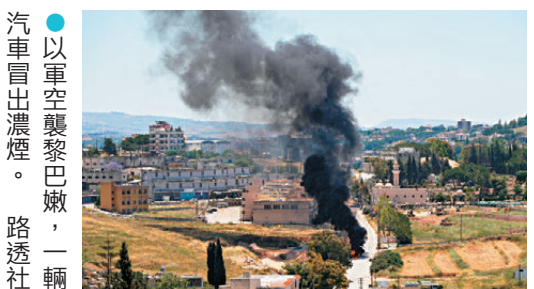
●以軍空襲黎巴嫩，一輛汽車冒出濃煙。