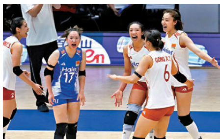
●中國女排球員在比賽中慶祝得分。

中國女排昨日(5日)輪空，今日(6日)和明天(7日)將分別迎戰塞爾維亞隊和波蘭隊。