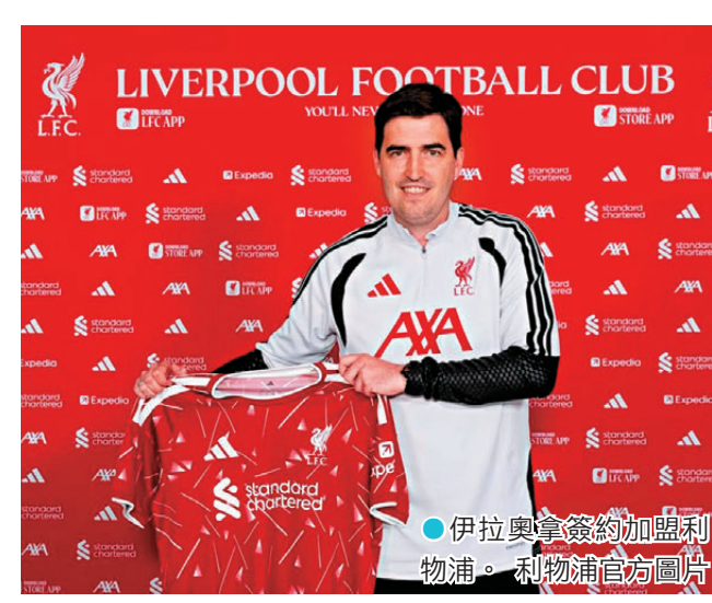
●伊拉奧拿簽約加盟利物浦。

是一家世界級的偉大球會，在球壇上舉足輕重。於我而言，有機會執教頂級球員、為爭逐冠軍而戰，實在十分有吸引力，我已急不及待地想要開始工作了。」