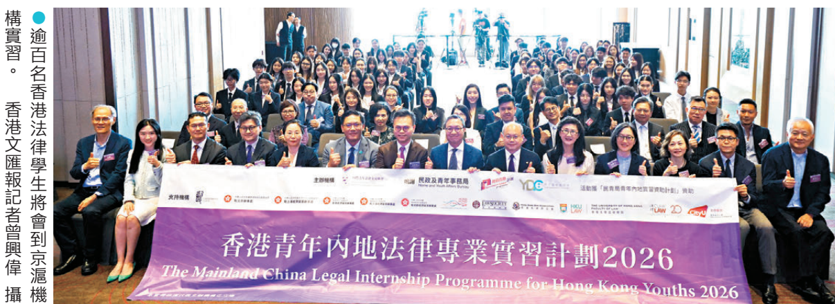
逾百名香港法律學生將會到京滬構實習。

香港文匯報訊(記者 黃子晉)由國際青年法律交流聯會主辦、香港特區政府民政及青年事務局和青年發展委員會資助的「香港青年內地法律專業實習計劃2026」啟動禮昨日舉行。有曾參加計劃的學生在座談會分享實習經驗時表示,計劃讓大家可以到訪內地的不同部委、法院,走進仲裁中心、律師事務所實習,見識到國家的司法建設很重視民眾參與和監督、注重現代化、公開透明,更有機會參與處理涉外案件、準備庭審材料等,收穫巨大,呼籲新一屆參加者要珍惜機會,以求知的心去體驗,以改進自身不足。