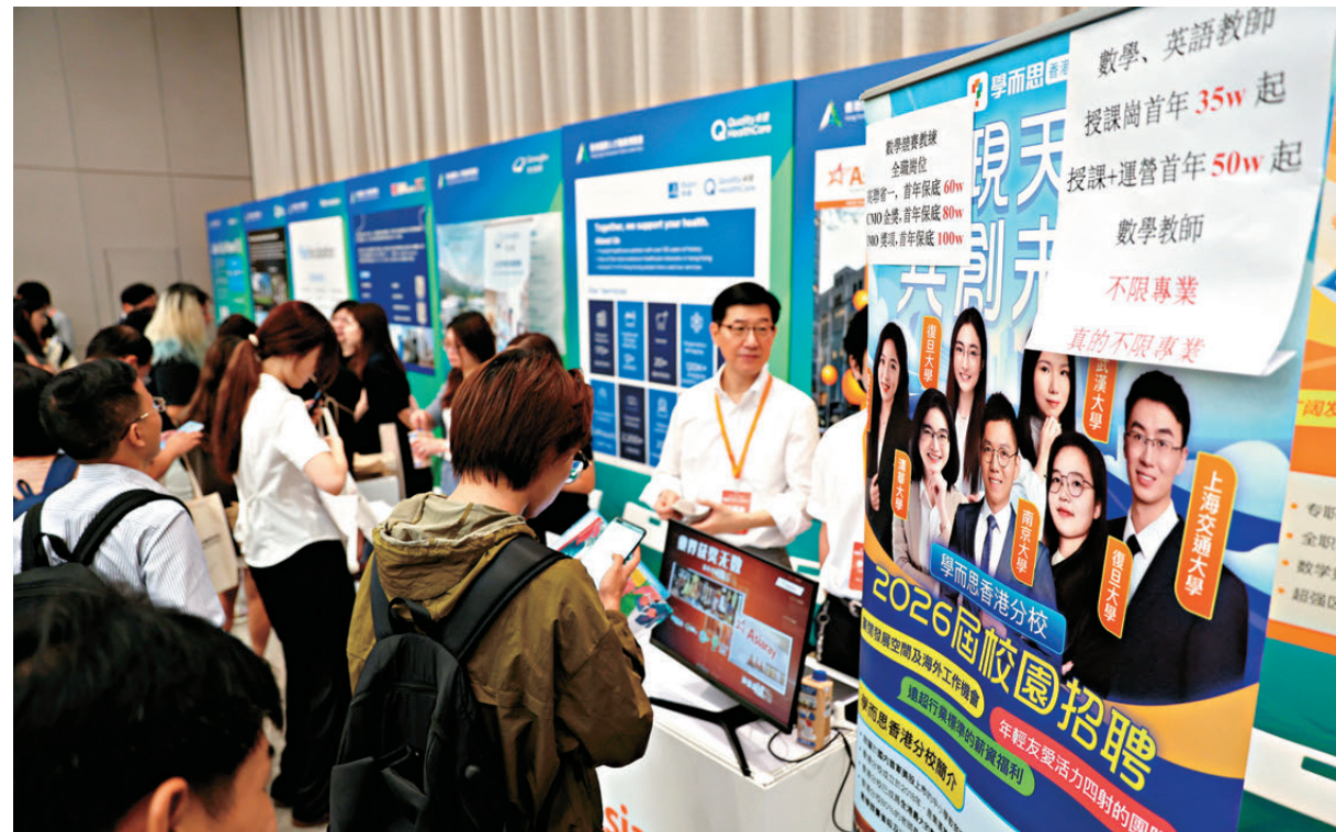
●有教育機構展示薪酬水平。

英國華威大學金融碩士畢業生Lauren來自深圳。她說,現場不少參展商只讓求職者掃碼投遞履歷,較少提供即場面試,「我希望可以在現場有面談的機會,更好地了解公司及應聘崗位。」她曾在內地大公司擔任金融產品經理,擁有豐富經驗,希望找到與專業匹配的金融中後台職位,繼續在香港發展。