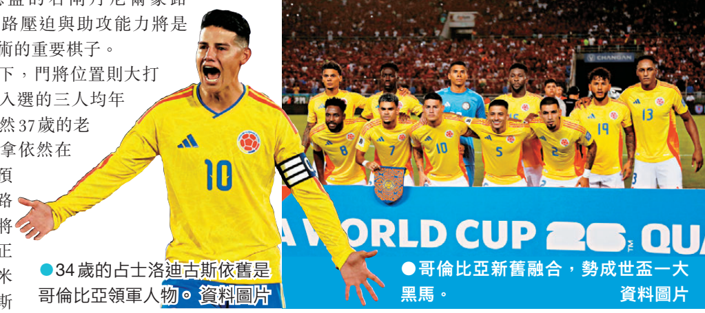
●34歲的古士洛迪古斯依舊是哥倫比亞領軍人物。

羅倫素成功將老將的經驗與新星的活力融合，打造出控球極具侵略性且擅長利用死球破局的實力之師。只要戰術執行得宜，這支哥倫比亞絕對具備複製12年前殺入八強，甚至衝擊準決賽的黑馬實力。