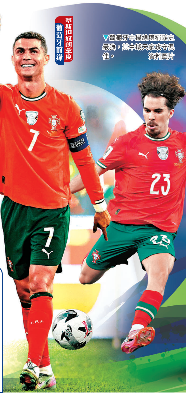
基斯坦奴朗拿度 葡萄牙前鋒