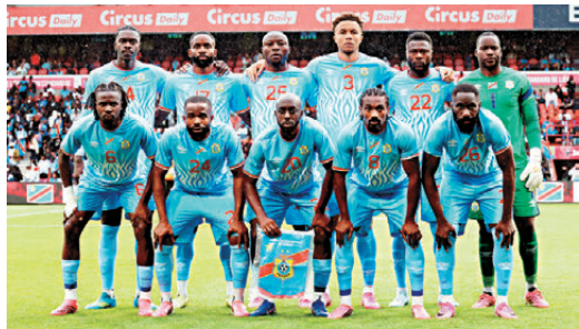
●剛果民主共和國相隔52年重返世盃舞台。