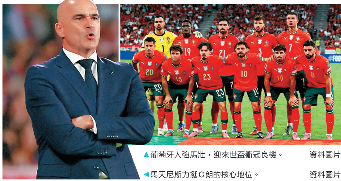
▲葡萄牙人強馬壯，迎來世盃衛冠良機。