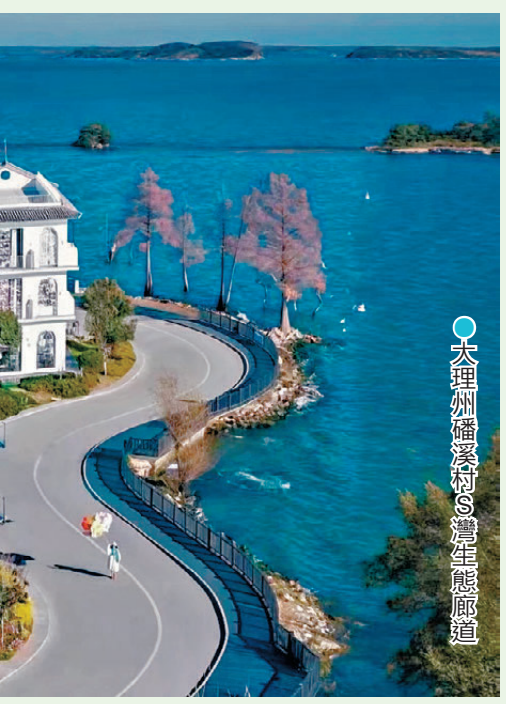
●大理州鶴慶村S灣生態廊道

去到大理，面朝洱海，當然要到大理州鶴慶村的S灣生態廊道參觀打卡。在這裏，遊客可以租賃自行車，沿環海棧道騎行賞景。一路上湖邊步道與騎行道相伴，欣賞S灣與洱海湖相互映襯的美景。在湖光山色的自然美景下，可嘆着咖啡享受夏日清涼的微風及陽光，蒼山洱海盡收眼底，日出日落絕美。