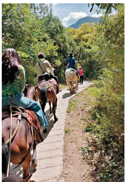
●旅客可以體驗騎馬走古道。

旅客體驗騎馬走古道，費用約300元，原生態馬道約2公里，需1小時穿過山林湖群，地勢高、山路險，可以欣賞壯觀的自然風光，而一路上有馬伕講馬幫故事。之後再去欣賞一場大型演出《麗江千古情》，可更加了解馬幫每次踏上征程的生與死體驗。