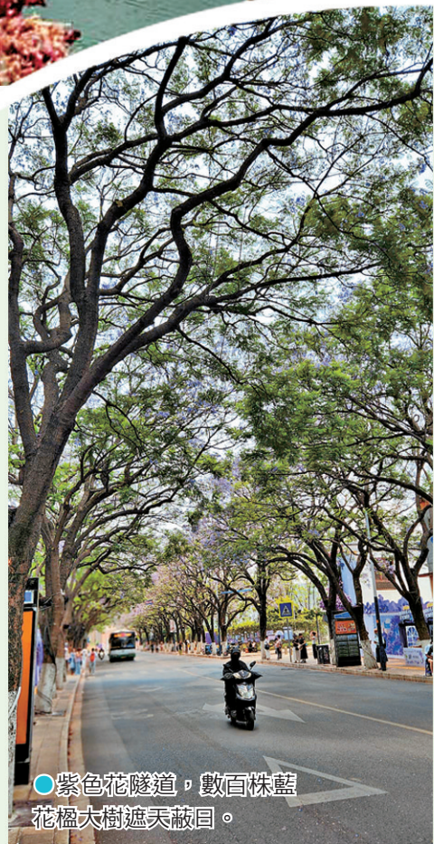
●紫色花隧道，數百株藍花楹大樹遮天蔽日。

之後我們還去了亞洲最大的鮮花交易市場——斗南花卉市場。對一個喜愛花的人來說，看到上千種不同的花卉植物，真是心花怒放、流連忘返，整個人都沉浸在花香與色彩的世界裏，樂在其中！