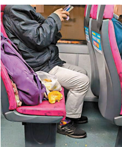
今年1月，有人在巴士內大聲播片，再將咬了一口的小菠蘿包放在座位上。

該等車輛的人，不得在車內或車上的時候使用或操作任何嘈吵的器具、樂器或任何留聲機、收音機或錄音機，而滋擾到任何其他人士；第五十七條(1)則列明，任何人無合理辯解而違反上述條例即屬犯罪，一經定罪，可被判罰款3,000元及監禁6個月。