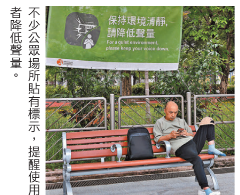
不少公眾場所貼有標示，提醒使用者降低聲量。

現時不同的交通工具都有相關規定，例如《道路交通（公共服務車輛）規例》第三七四D章第四十六條(1)(n)(i)，「公共巴士、公共小巴或的士之乘客或有意乘搭