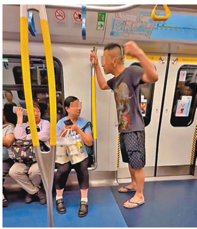
4月，港鐵有惡男（右）使用手機大聲聽取微信語音騷擾全車乘客，有婦人勸其收細聲量，惡男竟以粗口回罵，更揮拳作勢攻擊。