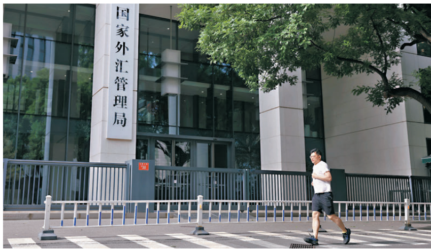
●中國外匯儲備2月、4月及5月站穩於3.4萬億美元，連創新高。

國家外匯管理局昨日公布最新數據顯示，截至今年5月末，中國外匯儲備規模為34,422億美元，較4月末上升317億美元，升幅為0.93%。至此，外儲規模已連續兩個月站穩3.4萬億美元，並創下2015年11月以來的最高水平。專家對香港文匯報表示，中國外匯儲備創下逾十年新高，釋放出兩大信號，一是中國經濟的基本面韌性較強，二是中國國際收支穩健性較好。在複雜多變的全球金融環境下，近期中國外匯儲備規模維持在3.4萬億美元以上的高位，不僅體現跨境資金流動的內生穩定性，亦彰顯外匯儲備抵禦外部衝擊的「壓艙石」效能。 ●香港文匯報記者 朱燁 北京報道