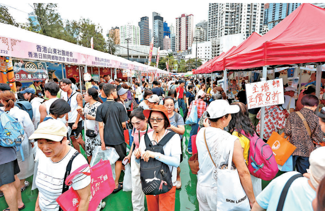
●第四屆「同鄉社團家鄉市集嘉年華」昨日煞科。