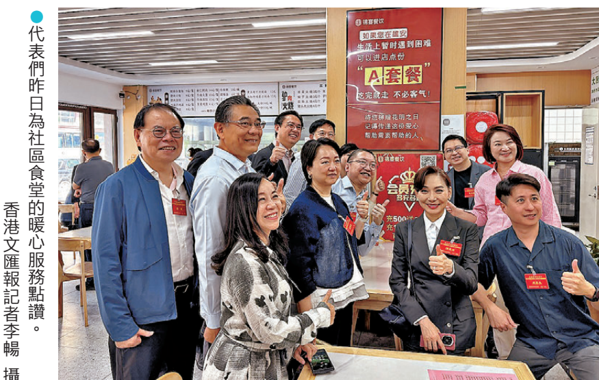
●代表們昨日為社區食堂的暖心服務點讚。

港區全國人大代表沈漢迪對雄安新區中關村科技園的生態聚合與跨區域協同印象深刻，指園區圍繞智能網聯、空天信息、人工智能等方向，構建了「一棟樓一條鏈」產業模式，「上下樓就是上下游」成為常態，各創新單元不僅在物理空間上相鄰相伴，更在產業鏈中緊密結合，煥發出強勁的集群動力。