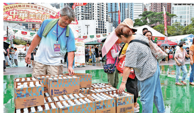
▲有攤位在休息區免費派發飲用水。