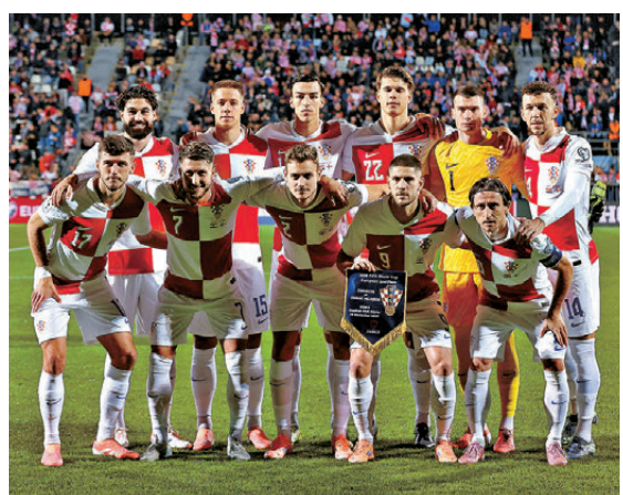
●克羅地亞希望連續三屆取得佳績。

等黃金一代帶領下，奮戰至決賽才不敵法國屈居亞軍。到2022世界盃，外界均以為陣容老化的克羅地亞難以再創奇跡，但球隊卻憑藉出色的防守加上莫迪歷的一人之力，沿途過關斬將殺入四強，最終僅負於最後冠軍阿根廷腳下，但仍能取得季軍。到今屆比賽，克羅地亞核心莫迪歷已屆40歲，過去球季在AC米蘭雖依然有不俗表現，但受制年齡問題明顯活力已大不如前，傷患亦逐漸增多，難免令球迷擔心這位前皇馬球星今屆能否繼續獨挑大樑。