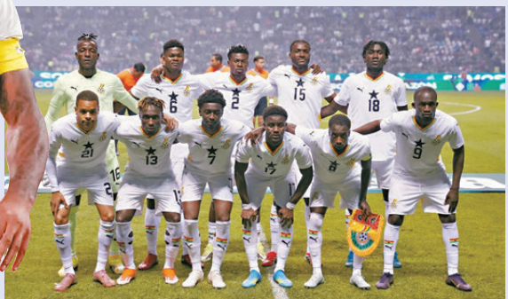
●加納近期在反賽表現欠佳。

香港文匯報訊(記者 張發兒)隊史第五次出戰世界盃決賽周的加納於今屆世界盃將面臨極大考驗，球隊在世界盃前三個月換帥，由奎羅斯上任，兼且對上兩場友誼賽未嘗一勝，似乎奎羅斯仍未找到最適合加納的戰術體系。即使奎羅斯這種執教資歷深厚的人，也不得不承認，從上任到首場比賽僅有65天，接下加納主帥一職是他教練生涯中「最大的挑戰」。