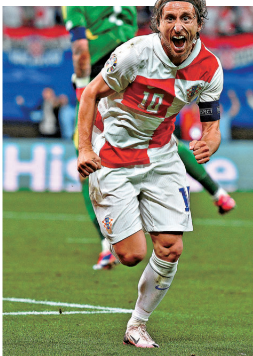
●莫迪歷將上演世界盃最後一舞。資料圖片

另外，克羅地亞過去引以為傲的防守問題亦令人擔心，效力曼城中堅加華度爾由於受傷關係，直至聯賽最後階段才趕及康復並取得少量上