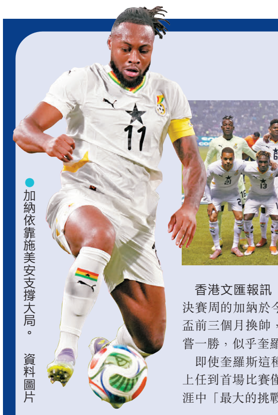
●加納依靠施美安支撐大局。資料圖片