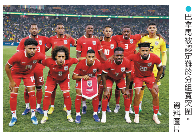
●卡拉斯基利亞是巴拿馬核心球員。資料圖片