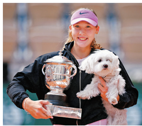
安德烈耶娃在法網賽後。

香港文匯報訊綜合新華社和中央社報道，2026年法國網球公開賽女單決賽6日進行，賽會8號種子安德烈耶娃以6:3、6:2戰勝資格賽選手赫瓦林斯卡，職業生涯首次獲得大滿貫女單冠軍。