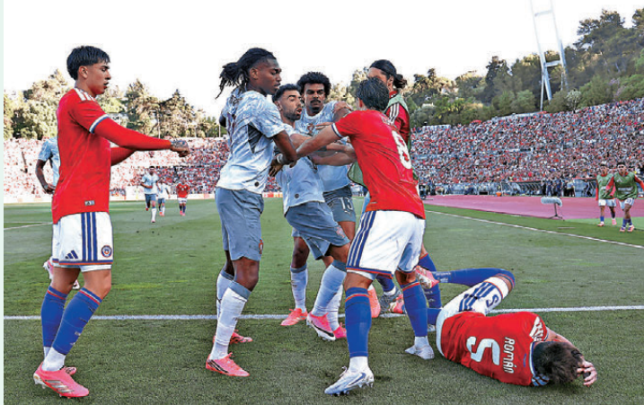
拉菲爾利亞奧(左二)與對手爆發衝突。