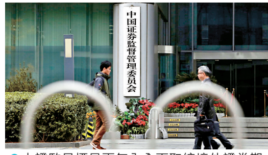
●中證監目標是兩年內全面取締境外證券期貨基金經營機構的非法跨境經營活動。

目前，3家中證監納入整治的跨境券商富途、老虎國際和長橋均已對其存量投資者在內地的服務作出整改。內地交易服務將自6月12日起暫停股票等所有品種買入交易，並暫停資金轉入服務。